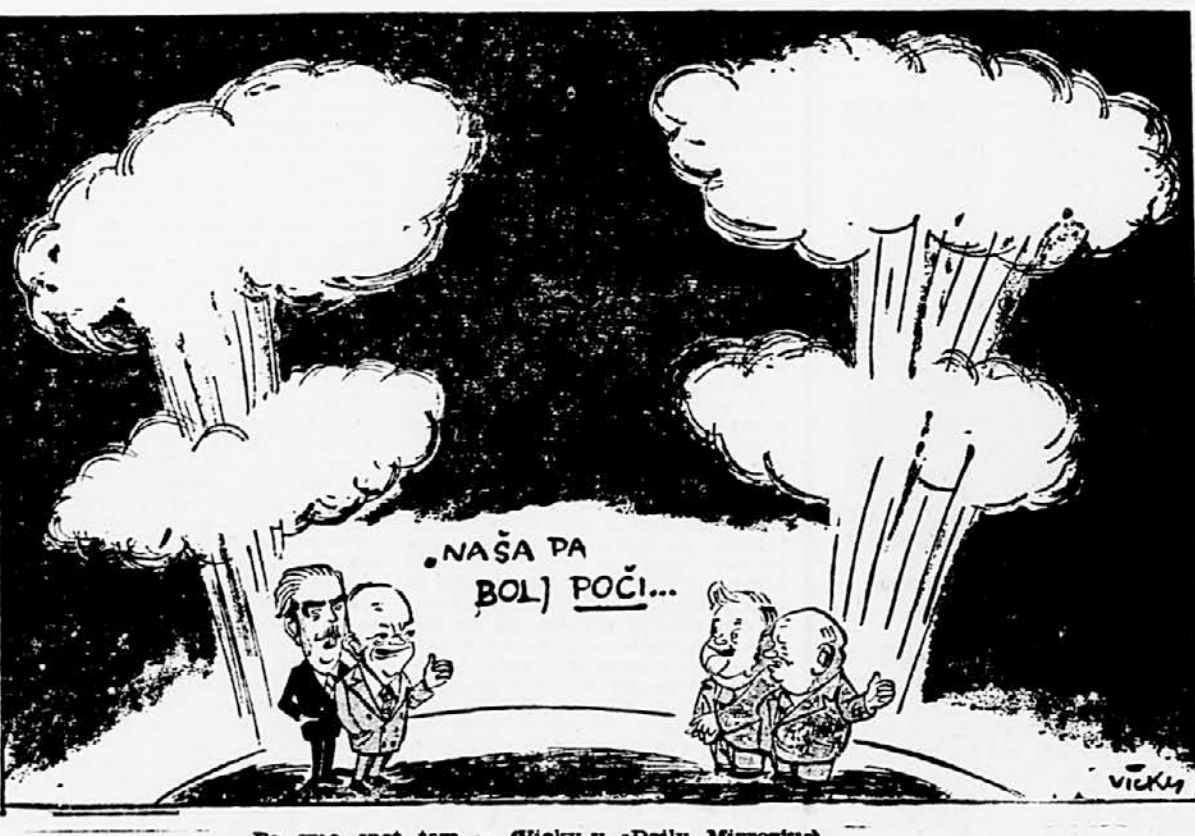
Pa sme spet tem... (Vickly z »Daly« Miroslav)

Pariz, 9. dec. (AFP). Sindikat občinskih uslužbencev javnih služb je zagrozil, da bodo njegovi člani 2. januarja na dan francoskih volitev, stavkali, če vlade ne bo ugodila njihovim zahtevam za zvišanje plač.