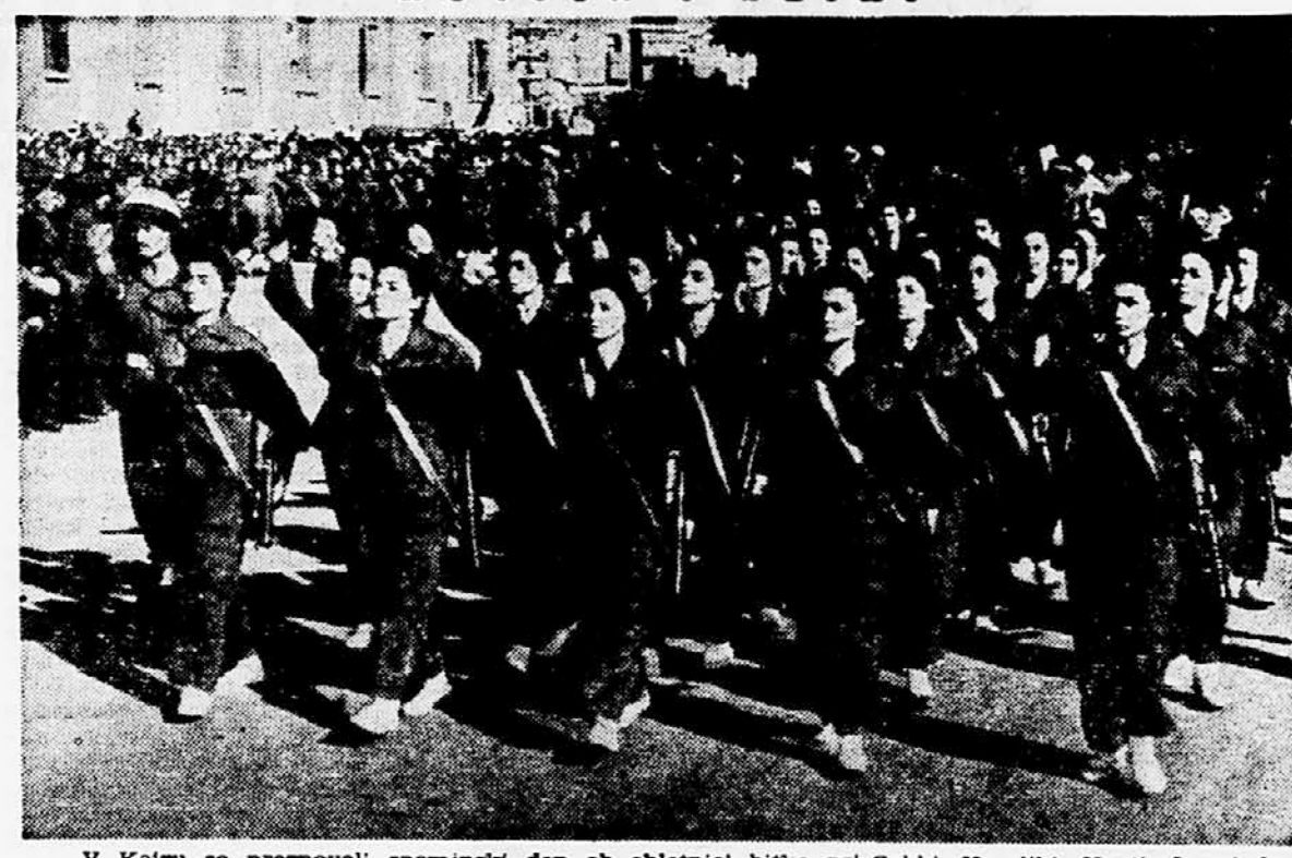
V Kairu so praznovali spominski dan ob obletnici bitke pri Sabhi. Na sliki: Na tisoče mladenčev in deklet nacionalne garde koraka proti mešaji Al Azhar, kjer je bila slovesnost.

Politični opazovalci so prepričani, da razkol v radikalnem vodstvu ne bo vplival na enotnost radikalnih volivcev, da pa koalicijska republikanska levica v najslabšem primeru lahko dobi največ dve sto poslanskih mandator, kar ne zadostja za sestavo vlade. Mendes-France in socialistični prvak Guy Mollet sta v današnjem uradnem sporočilu iz-