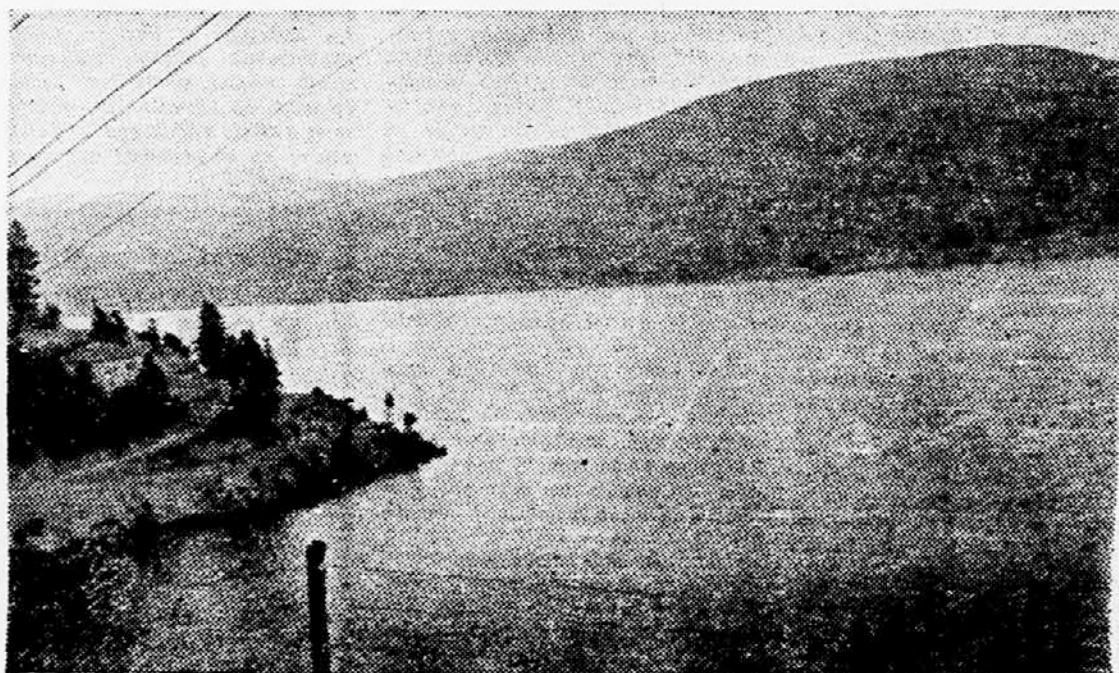
Umetna jezera, iz katerega bodo črpale energijo mavravske hidrocentrale v Makedoniji

Napoved za soboto: Suho, deloma menjaajoče se oblačno vreme. Zjutraj po kotlinah rahla megla. Temperatura ponoči mem -7 in -4, v Primorju 4, podnevi med 4 in 6 in vetrovni C.