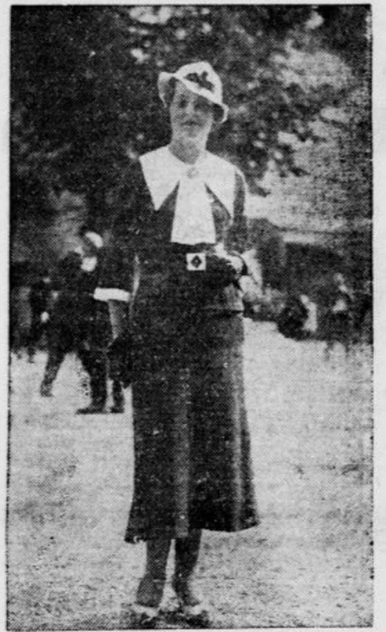
Enostavna, a prikupna obleka za jesen Zermatt, izhodišče v švicarske Alpe