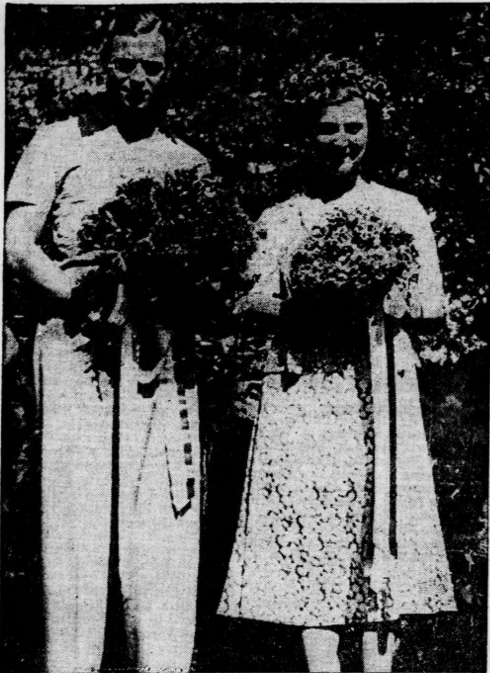
»ta se odpeljala iz Bohinja v London, kjer bodo grški princ Nikolaj, njegova soproga in nevesta princesa Marina sprejeti od angleške kraljeve obitelji v posebni avdienti«