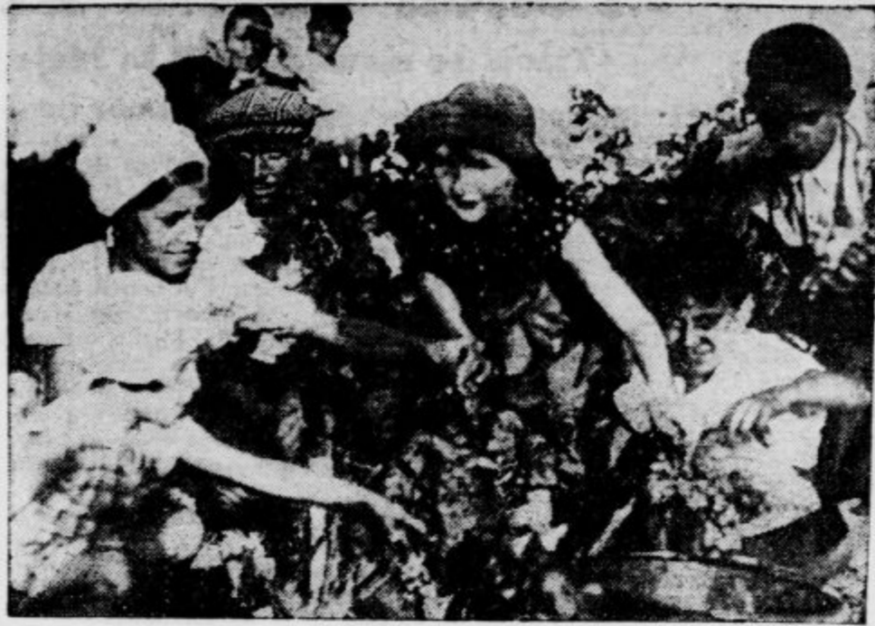
in veselji trgači nam bodo kmalu pripravili iz grozolja novo vino