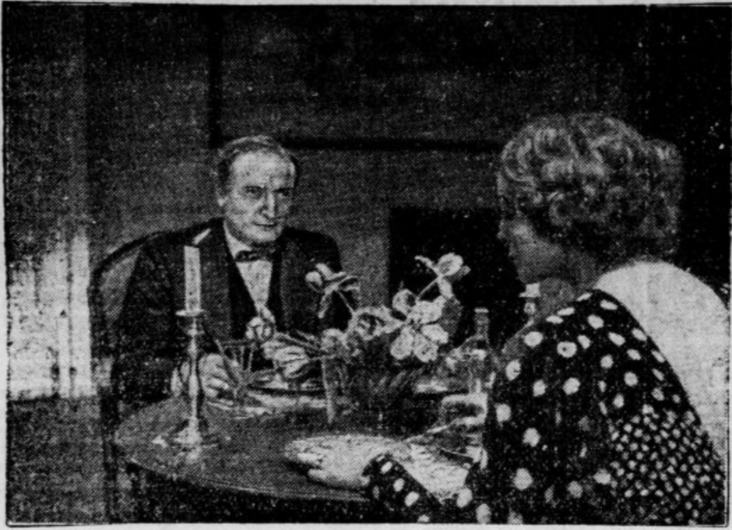
Hans Albers in Brigita Helms v enem iz med mnogih močnih prizorov reprezentativnega filma: »Zlatoc«