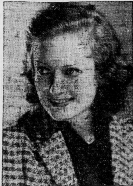
lečna žena Douglasa Fairbanks ml., trenutno ena najpopularnejših zvezdnic, se nam bo tudi letos predstavila v nekaterih odličnih ameriških filmih

Pri hemoroidalni bolezni, zagatenju, natrganih črevih, abcesih, sečnem pritisku, odebelih jetrih, bolečinah v križu, tesnobi in prsih, hudem srčnem utripanju, napadih omotice prinaša uporaba naravne »Franz Josefovke grenčice vedno prijetno olajšanje, često tudi popolno ozdravljenje. Strokovni zdravniki za notranje bolezni svetujejo v mnogih primerih, da naj pijejo taki bolniki vsak dan zjutraj in zvečer pol čaše »Franz Josefove vode«. »Franz Josefova voda« se dobi v vseh lekarnah, drogerijah in specerijskih trgovinah.