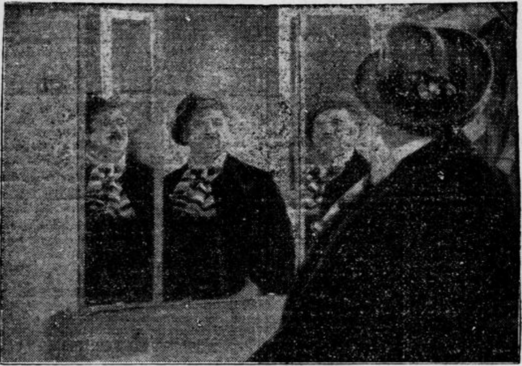
Štirikrat Leo Slezak kot komorni pevec Bumm v zvočnem filmu: Veselite se življenja!