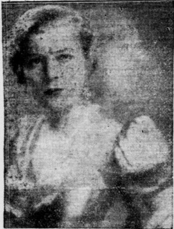
lečna žena Douglasa Fairbanks ml., trenutno ena najpopularnejših zvezdnic, se nam bo tudi letos predstavila v nekaterih odličnih ameriških filmih

Ta dva odlična družabnika, ki sta doslej napravila skupno že več zvočnih filmov, sta se že spet znašla v velikem Ufinem filmu »Viktor in Viktorija«. Seveda ju je tudi to pot spravil v idealno zvezo Reinhold Schünzel. »Viktor in Viktorija« je prava filmska opereta z izvrstnimi šlagerji ali