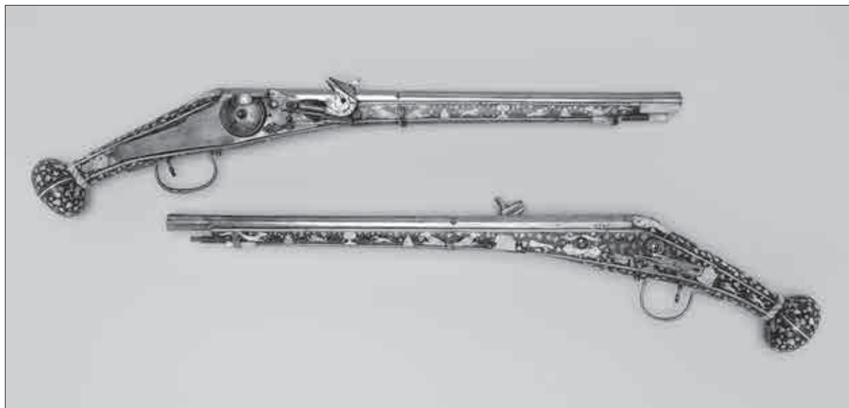
Par pištol s kolesnim netilnim mehanizmom, datiranih v leto 1571 (Narodni muzej Slovenije, inv. št. N 5187/1–2).

ška« oklepa. Prvi, »bogato graviran z vojnimi prizori«, naj bi izviral s konca 15. stoletja. Če bi to držalo, bi imeli opraviti z resnično rariteto, je pa takšna izjava težko razumljiva, saj je oklep v resnici treba datirati v 17. stoletje – a še to s pridržkom, saj očitno ne gre za originalno celoto, temveč pozneje temeljito restavrirane sklope, drugotno sestavljene v samostojni oklep. Kaj je novinarja napeljalo k opazki, da je po obliki in izdelavi »pristno gotski«, je svojevrstno vprašanje, saj se oklep jasno razlikuje od poznosrednjeveške zaščitne opreme gotskega sloga. 116