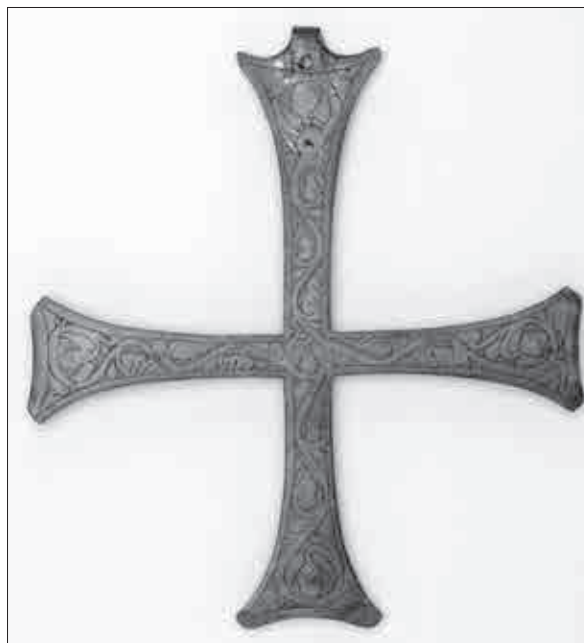
Romanski križ iz Kometrove zbirke (Narodni muzej Slovenije, inv. št. N 8359).

Izkupiček dražbe je bil torej v celoti slabši od dejanske vrednosti prodanih premičnin in upnikom ni povrnil toliko sredstev, kot bi jih načeloma lahko. A tega po vsej verjetnosti ne gre pripisovati neprimernim cenitvam niti tajnemu dogovarjanju licitantov, kot namiguje časopisje. Glede na neugodne krizne razmere in splošno pomanjkanje dovolj premožnih kupcev boljšega rezultata niti ni bilo razumno pričakovati.