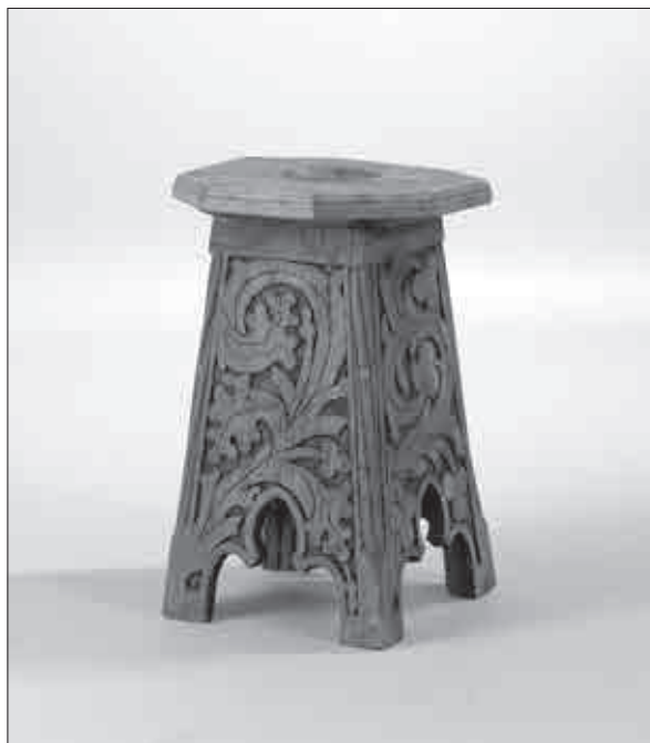
Stolček iz poznega 15. ali zgodnjega 16. stoletja (Narodni muzej Slovenije, inv. št. N 3802, foto: Tomaž Lauko).

Koliko je v takem pisanju resnice in koliko nacionalno sovražnega podtona, ni lahko objektivno presoditi, saj pisec v istem sestavku naniza nekaj nasprotujočih si izjav. Tako pripominja, da je bilo na Pukštajnu ob začetku licitacij veliko negotovosti o končnem uspehu dražbe. V strahu, da zaradi gospodarske krize med kupci ne bo pravega zanimanja, so izklicne cene premičnin namenoma postavili zelo nizko. Toda odziv je menda presegel vsa pričakovanja, še posebej ob prodaji gotskega pohištva in drugih kosov notranje opreme. Tedaj naj bi se dogajalo, da so na vsega nekaj sto dinarjev ocenjene predmete prodali tudi za zneske do 10.000 din – to pa pomeni, da je živahno povpraševanje navsezadnje vsaj do do-