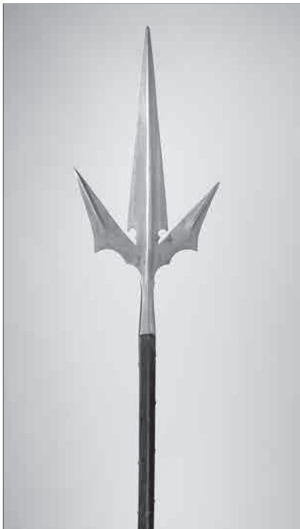
Korzeka iz 16. stoletja (Narodni muzej Slovenije, inv. št. N 5155,).