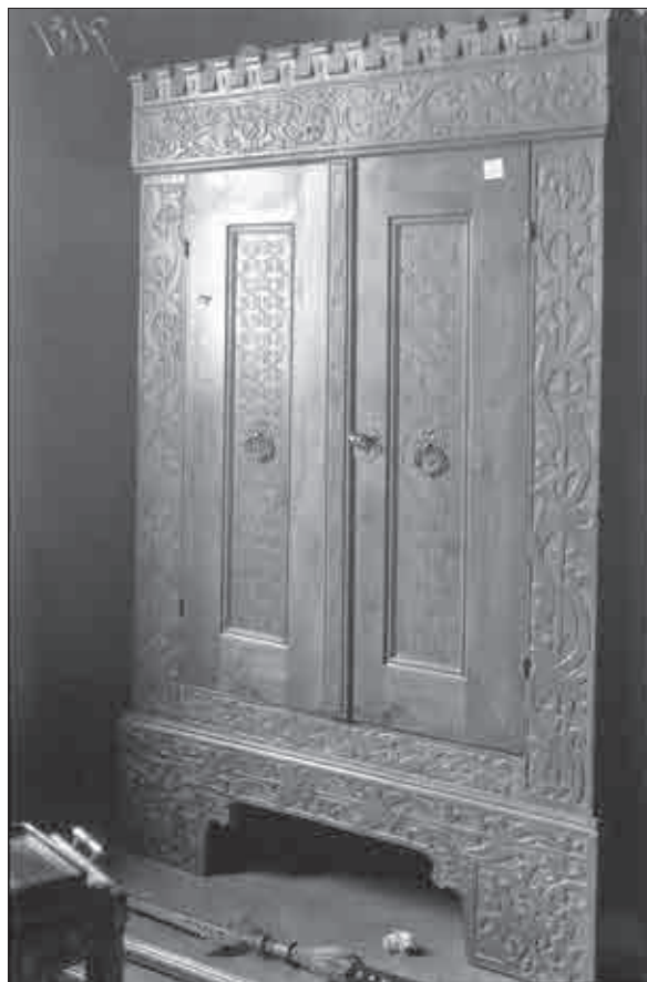
Omara z rezljanim okrasjem, na tleh bogato okrašena partizana in dve le delno vidni belebardji (Indok center, f00000-n14248n, foto: France Stele).

Usoda pukštajnskih starin se je znašla na nevar-