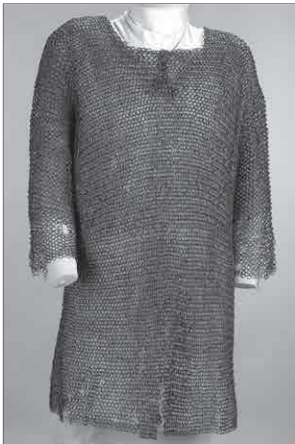
Verižna srajca iz poznega 15. stoletja (Narodni muzej Slovenije, inv. št. N 4587,).