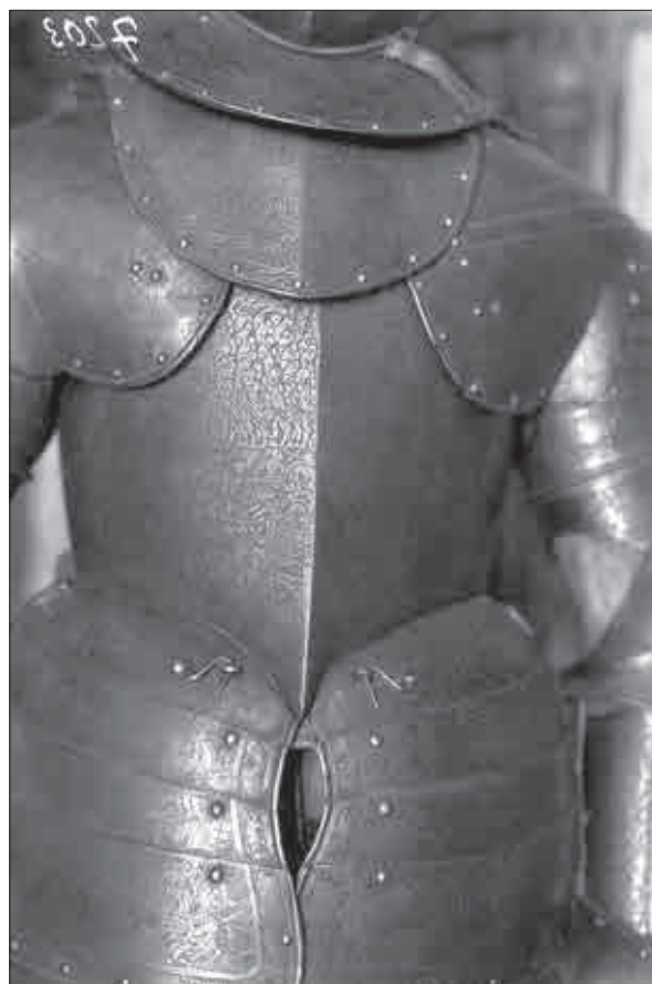
Jedkano okrasje ploščnega oklepa.