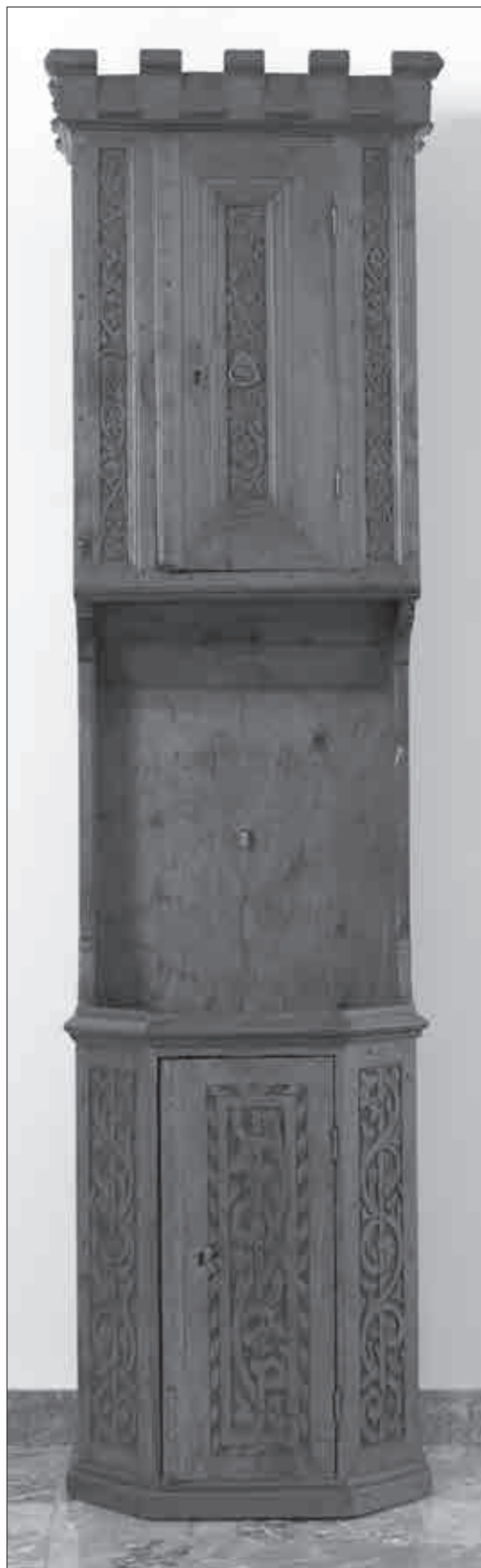
Umivalna omara iz 16. stoletja (Narodni muzej Slovenije, inv. št. N 3803).