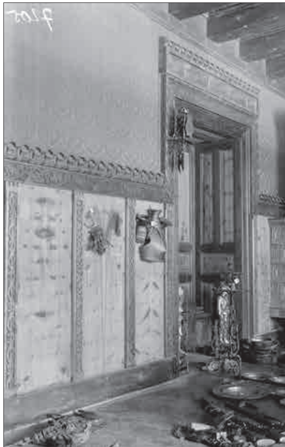
Baronova »viteška dvorana« v času popisovanja gradiva (Indok center, f00000–n14270n, foto: France Stele).

Čeprav je bila Kometrova zbirka zasebne narave, se iz časopisnih in leksikonskih omemb lahko pre-