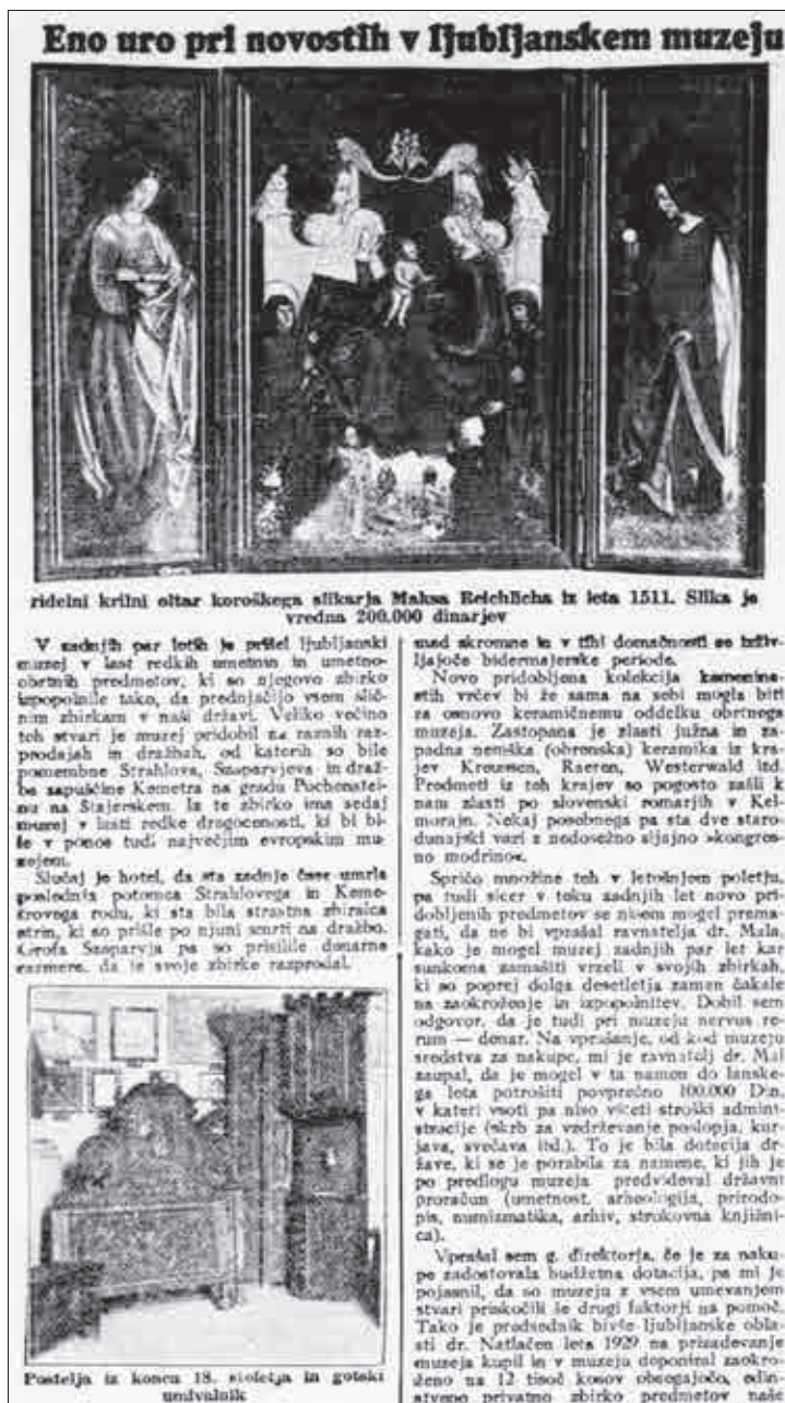
Eno uro pri novostih v ljubljanskem muzeju

ridelni krilni oltar koroškega slikarja Maksa Reichleha iz leta 1511. Slika je vredna 200.000 dinarjev