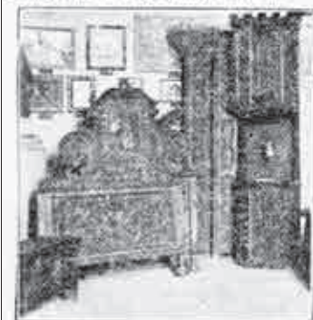
Postelja iz konca 18. stoletja in gotski umivalec

Slučaj je hotel, da sta zadnje čase umrle poslednja potomca Strahlovega in Kometrovega rodu, ki sta bila strastna zbiralca stvari, ki so prišle po njuni smrti na dražbo. Grofa Szaparyja pa so prisilile donatne obveznosti, da je svoje zbirke razprodal.