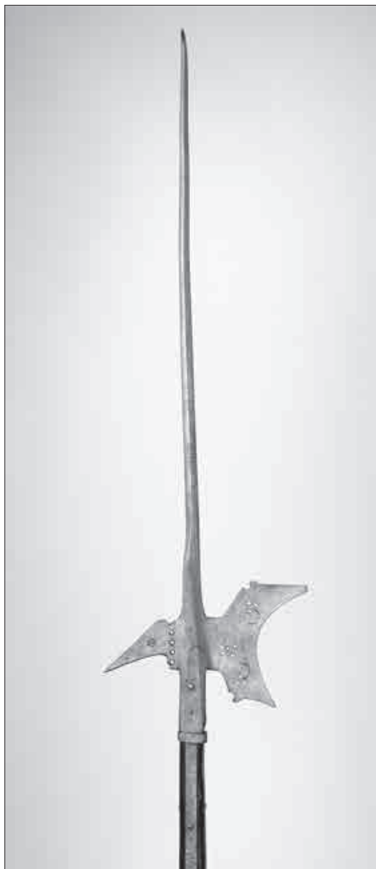
Helebarda iz zadnje četrtine 16. stoletja (Narodni muzej Slovenije, inv. št. N 32139).

za cenilnemu zapisniku, ki ga je v letih 1931/2 med vrednotenjem pukštajnskih premičnin sestavil Zorman – po njegovih ocenah je vrednost baronove zbirke starega orožja znašala 74.685 din. 124