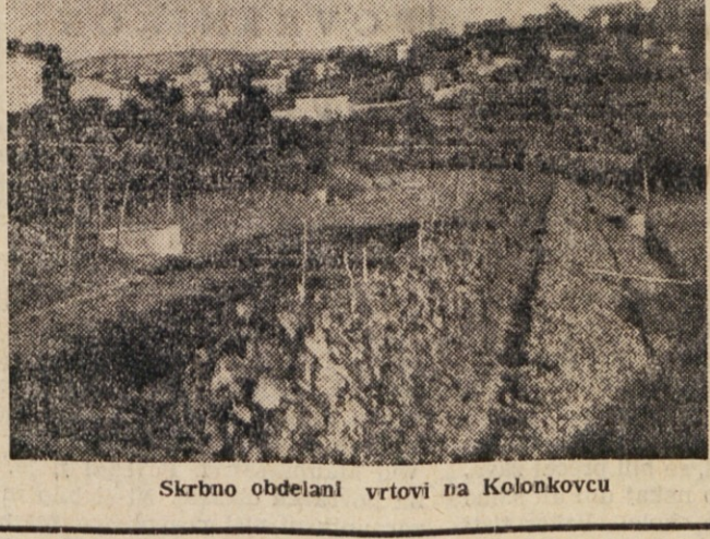
Skrbno obdelani vrtni na Kolonkovcu

Stopim iz travnjaka in jo po ozki poti zaviljem za mestnim pokopališčem. Burja ostro piha in na vrtu, ce bom imel srečo, v takem vremenu vsak najraje tiči doma, ce le more.