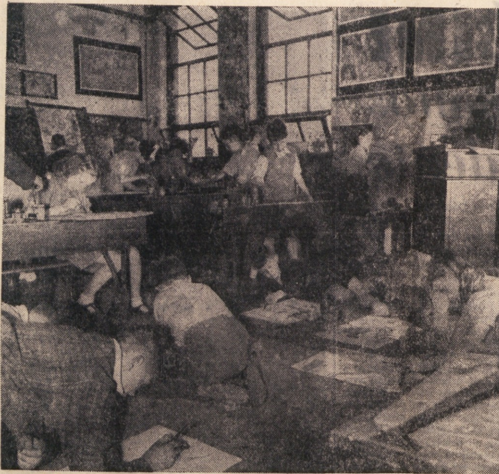
V Veliki Britaniji uvajajo sedaj nov način pouka, pri katerem je poudarek v glavnem na ročnih delih in umetniškem udeleževanju otrok...