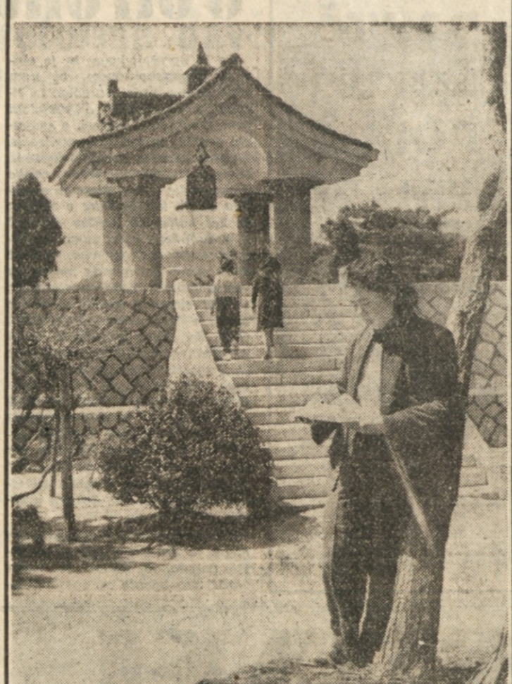
NA OTOKU NAGASHIMA, V BLIZINI MESTA ENAKEGA IMENA ZIVE LJUDJE, OKUŽENI PO STRANSKI BOLEZNI GORAVOSTI, POPOLNOMA LOČENI OD OSTALEGA SVETA. NAVJEČJA UTEHA PREBIVALCEV ZALOŠTEGA KRAJA JE PISMO DOMAČIH, KI ZIVE SREČNEJŠE ŽIVLJENJE