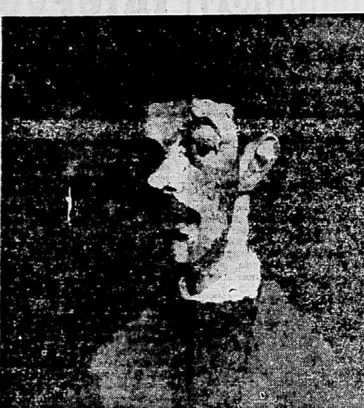
Floris Oblak: Lastna podoba (1956)