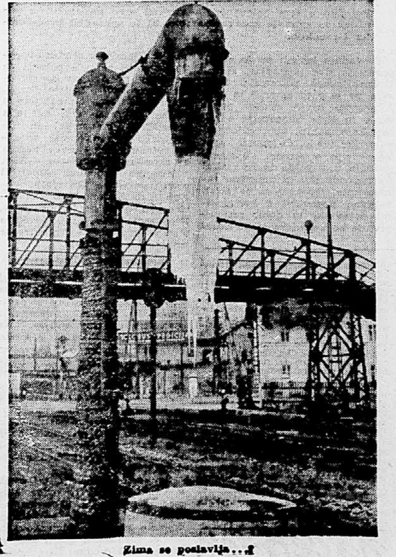
Zima se posilavlja...