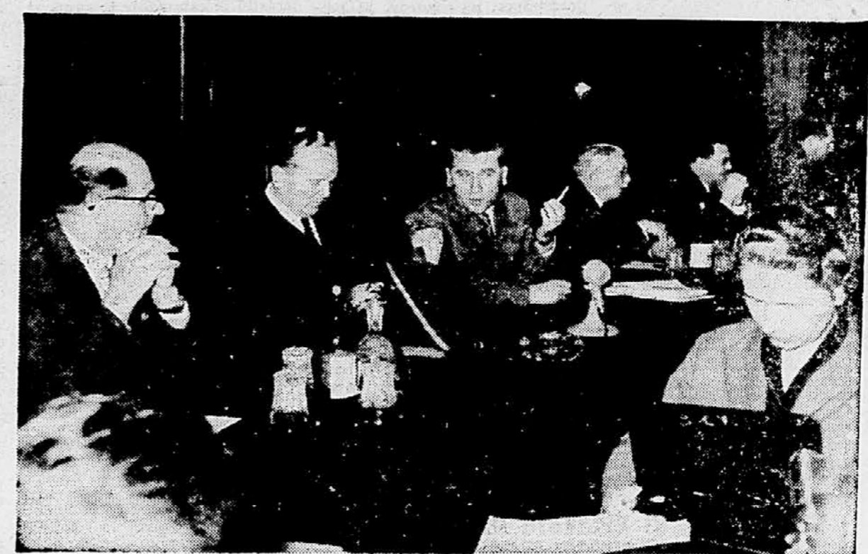
Član izvršnega komiteja CK ZKJ med zasедanjem VI. plenuma

Tu je važno tudi vprašanje pionirjev. Na koncu pionirske organizacije formalno nismo razpustili, toda demobilizirali smo komuniste in Socialistično zvezo v delu z njimi. To da brez neposredne pomoči od raslih ljudi, predvsem pa sta-