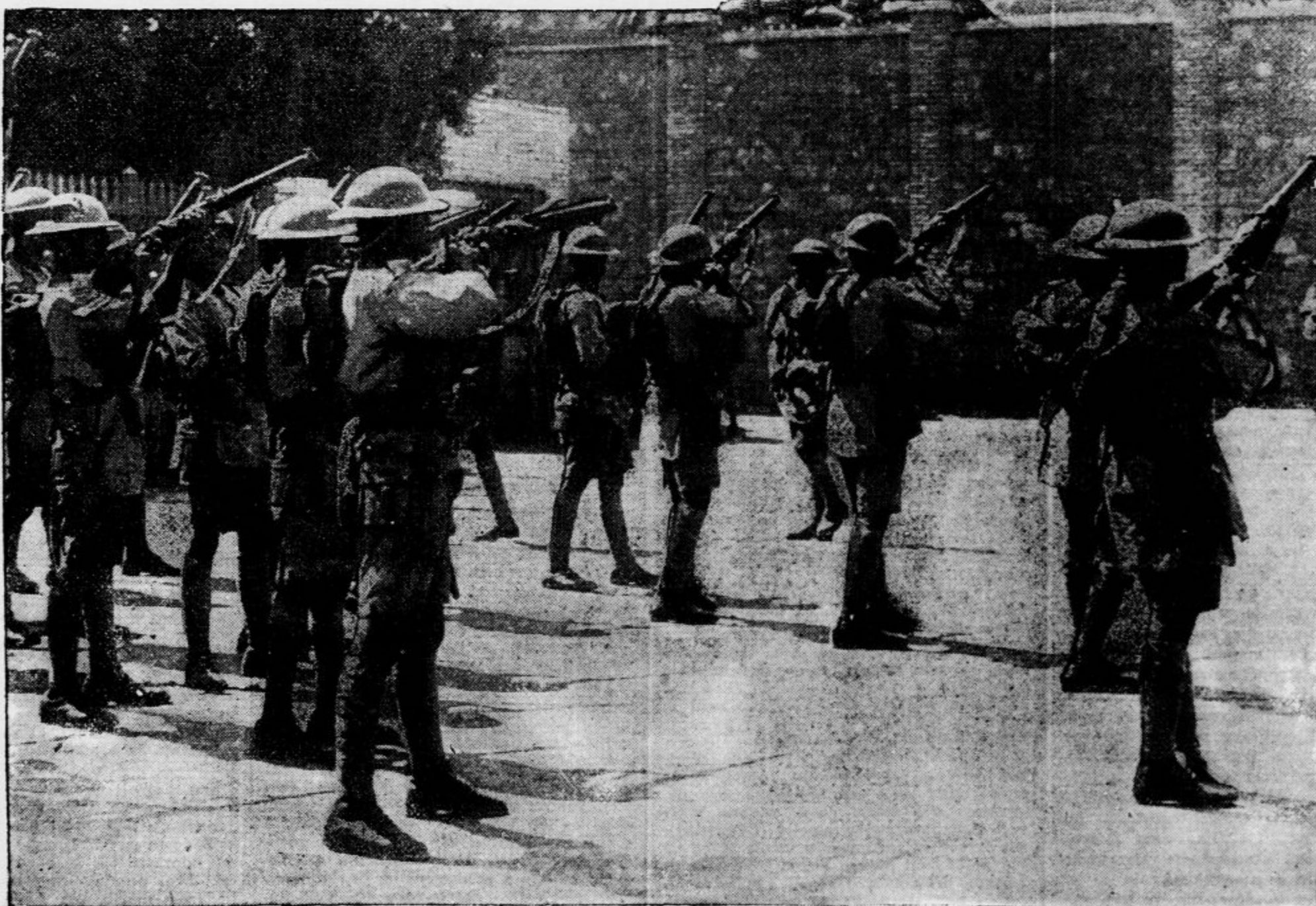
Ob zadnjih nemirih v Hawandiji je moral nastopiti oddelek angleških vojakov proti domačinom, ki so se utrdili v neki hiši