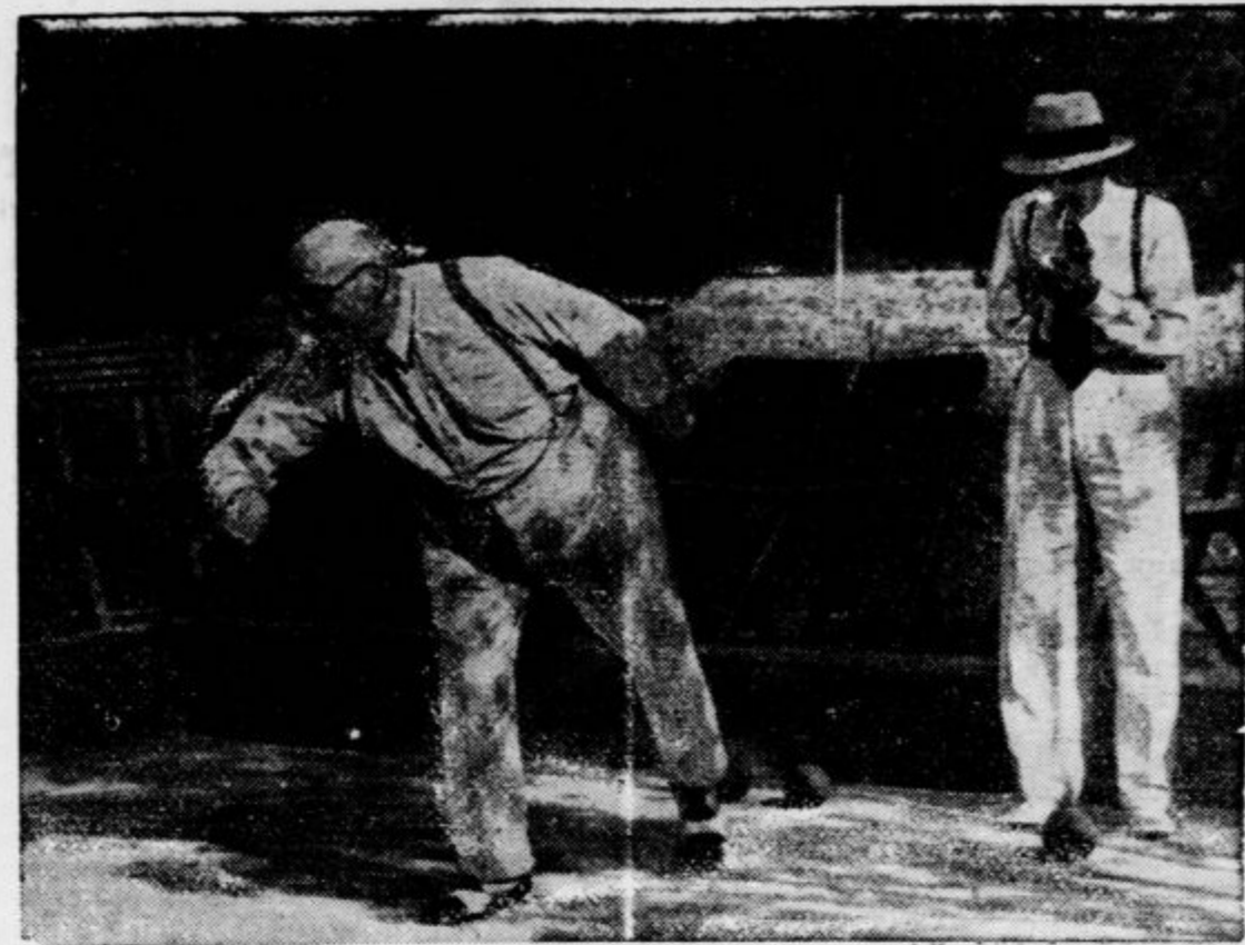
Maršal Badoglio, vojvoda Adis Abebe, je šel na dopust v Fiuggi pri Rimu, kjer pridno balina.