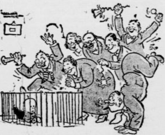
»Hvala bogu, da sem tu notri!« (»Everybodys weekly!«)