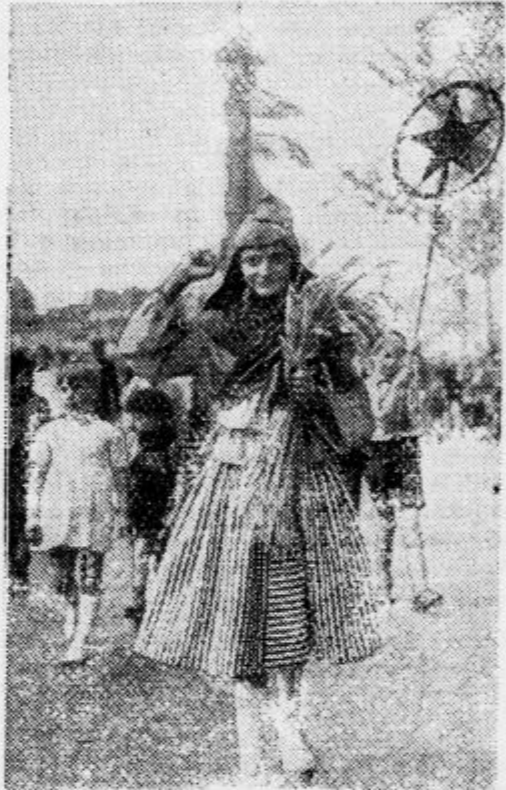
Marijana iz severnofrancoskega mesta Fresnes, ki se je udeležila velikih slavnosti, ki so se vršile na dan francoskega narodnega praznika po vsej državi