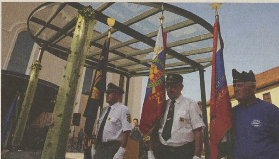
Na slovesnosti ob dnevu državnosti in otvoritvi Cankarjevega trga so nastopili številni zagorski pevski zbori, domači glasbeniki in kulturniki. Prisotni so bili tudi praporščaki različnih veteranskih organizacij.

Zagorje gre naprej; Združenje za napredek Zasavja se je tako kot vsako leto tudi letos odzvalo povabilu za donacije Območne enote Rdečega križa Zagorje ob Savi. Združenje je soglasno sprejelo odločitev, da tudi letos nameni del sredstev za počitnikovanje otrok iz socialno ogroženih družin. V združenju želimo po svojih močeh pomagati tudi na način, da svoja lastna sredstva