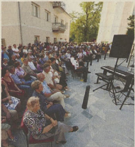
Zbrane je navdušil pester kulturni program slavnostne otvoritve Cankarjevega trga.

Proslava na dan državnosti je potekala skupaj z otvoritvijo prenovljenega Cankarjevega trga. Znesek celotnega projekta je vreden 1.38 milijona evrov, pri čemer je uspelo Občini Zagorje pridobiti večji del sredstev iz Evropskega sklada za razvoj. Trg se razprostira med cerkvijo sv. Petra in Pavla, Glasbeno šolo Zagorje ter Osnovno šolo Slavka Gruma. Urejen je z novo komunalno infrastrukturo in površino, ki jo sestavlja pohorski tonalit. Pomemben utrip daje trgu paviljon sodobne oblike, ki bo v prihodnje namenjen manjšim glasbenim in kulturnim prireditvam. V tlak pa so vstavljene bronaste plošče z naslovi najpomembnejših Cankarjevih del. Cankarjev trg zajema tudi prenovljeno parkirišče, ki se nahaja za župniščem.