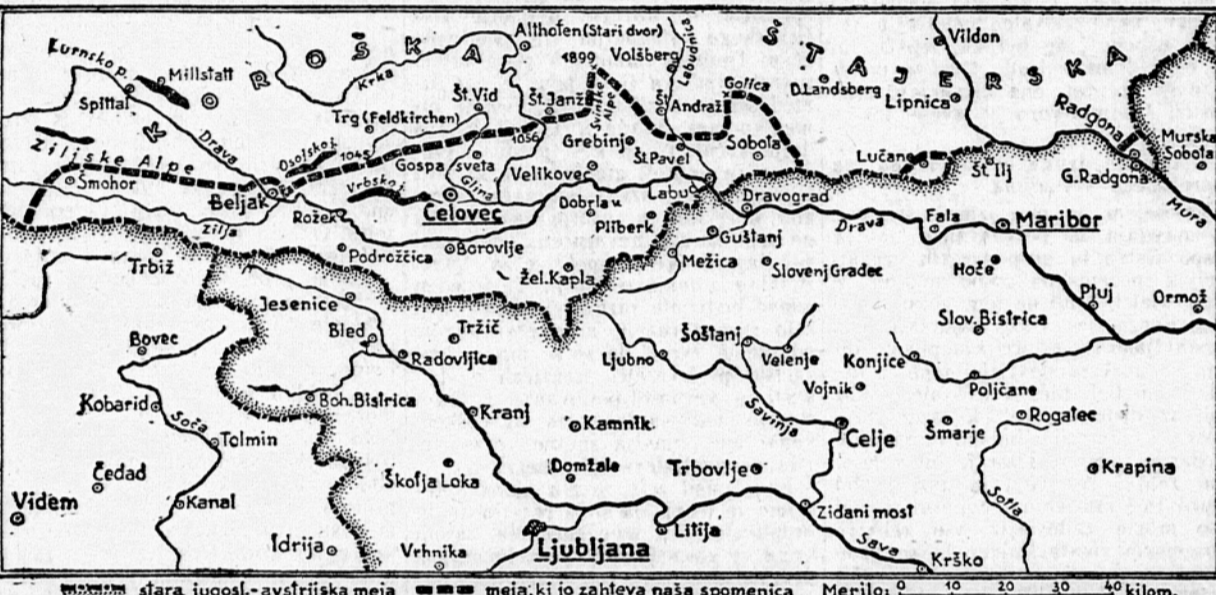
Da bi dokazala svojo željo po miru in omogočila spora zum v vprašanju jugoslovaško-avstrijske meje, je jugoslovaška vlada odstopila od nekaterih prvotnih zahtev po priključitvi ozemlja Koroške. Silka kaže: Gornja črtkana črta pomeni obseg prvotnih zahtev, ki so sedaj omejene na bivo plebiscitno cono A in B v površini 2066 km x 166.000 prebivalci. Jugoslavija je, da bi se dosegel sporazum, odstopila Ziljsko dolino z Beljakom ter odsek Golica—Sobota s St. Pavlom, čeprav so naše zahteve tudi do teh krajev globoko upravičene.

DOLGOROČNA VREMENSKA NAPOVED za prihodnji teden od 10. do 16. maja V splošnem še nadalje nestalno vreme s pogostimi padavinami, zlasti pa 10., 11., 13. in 16. Z lepim vremenom je računati 12. maja.