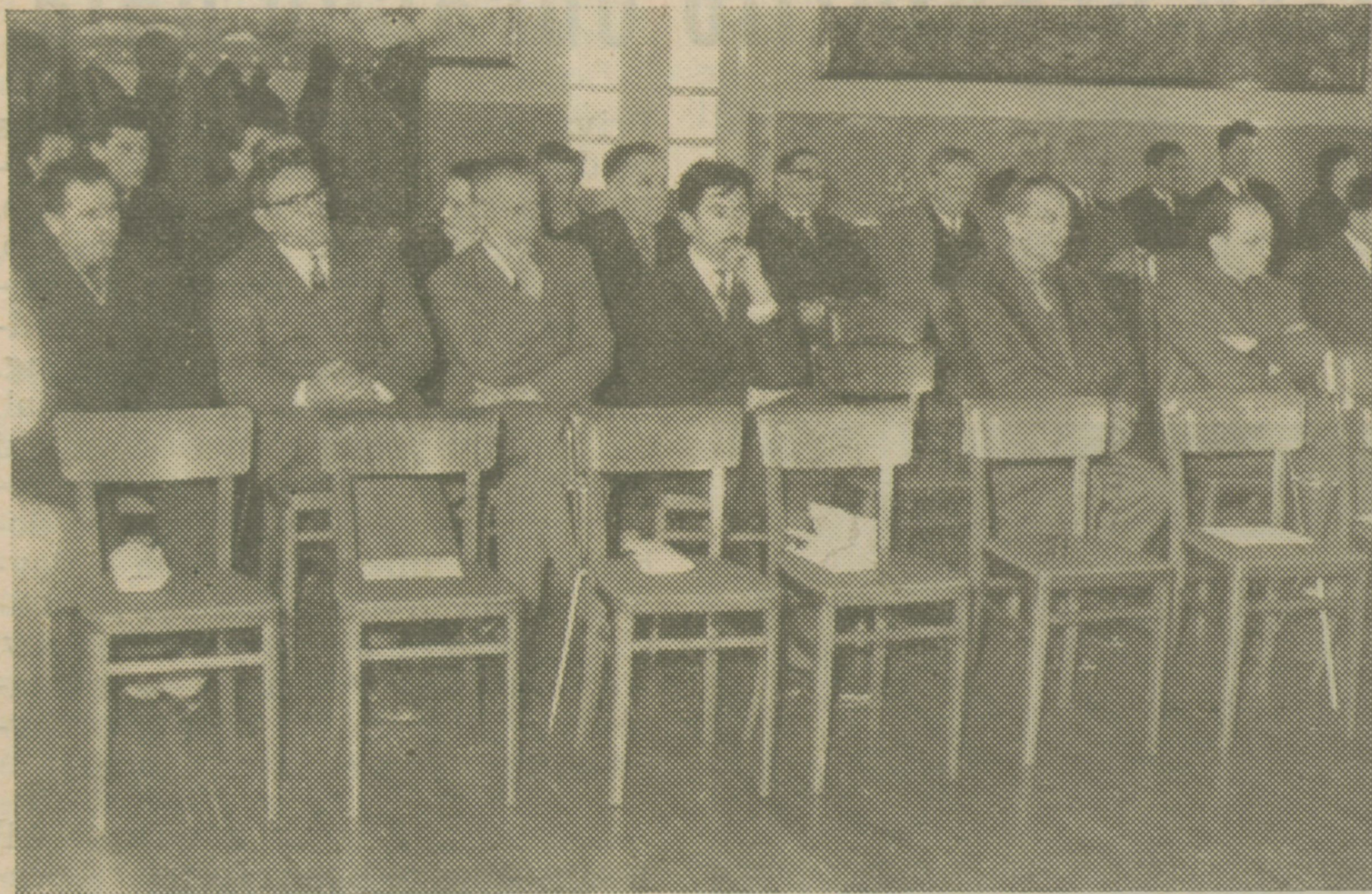
Z občnega zbora turističnega društva

Mnogo živahnejši promet izkazuje turistično društvo leta 1965, kar je mogoče ugotoviti iz poročila dohodkov in izdatkov. Tudi društvena dejavnost se je zelo razširila, saj je društvo poleg rednega dela pri posredovanju sob turistom in potnikom posredovalo pri izdaji potnih listov, prodajalo spominke in razglednice, menjavalo tuje valute, prevzelo še posle državne loterije, športne stave in igre »Loto«. Zaradi naraščajočega prometa so uredili in odprli novo turistično pisarno v Podgradu, ki je sekcija turističnega društva Ilirska Bistrica in je že v prvem letu dela pokazala zadovoljive uspehe, saj je bilo z enim honorarnim uslužbenecem posredovanih skoraj 1.920 nočitev in