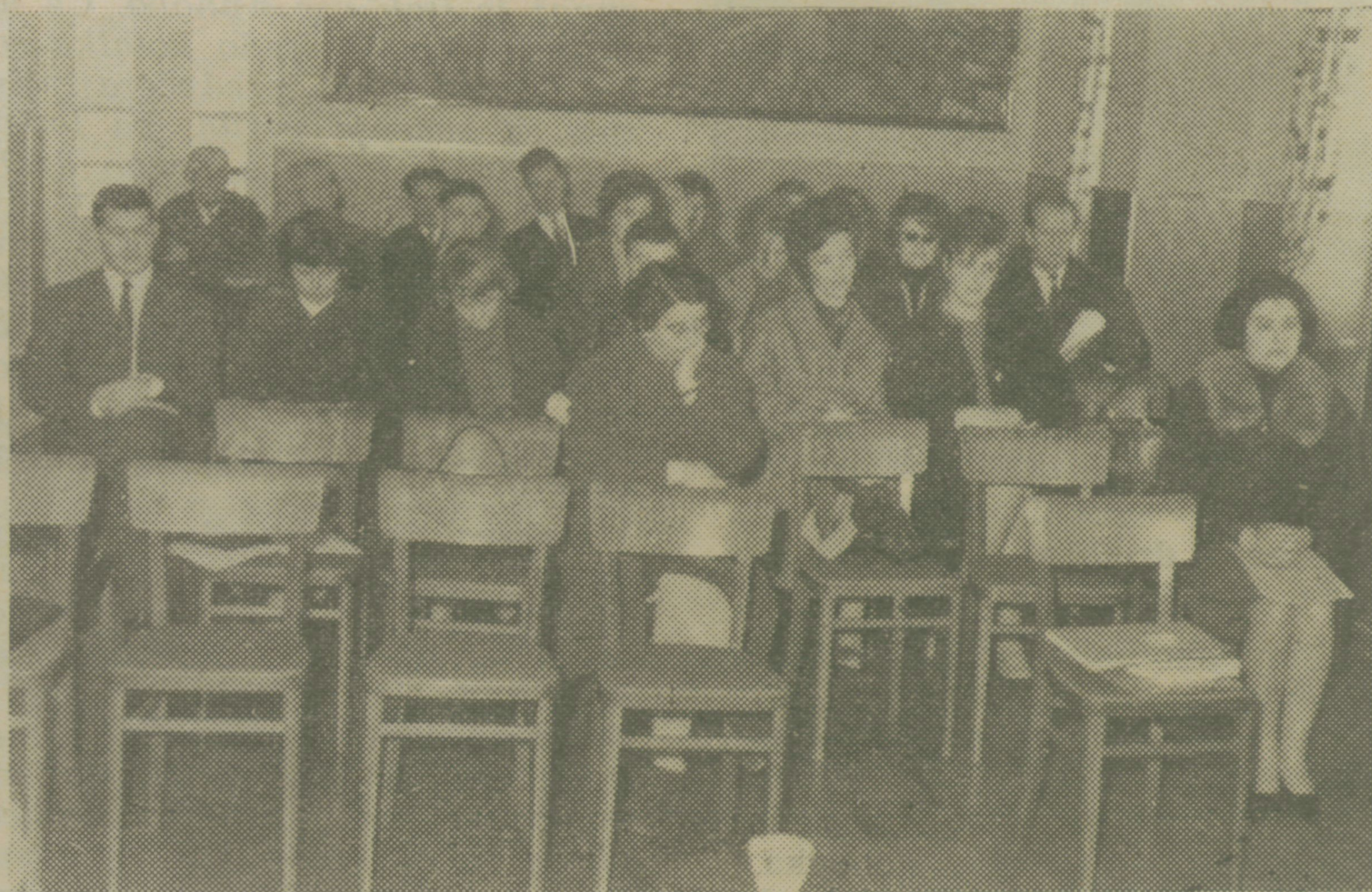
Z občnega zbora Turističnega društva

Začetek društvenega dela je bil težak. Tako je bilo slišati v razpravi in v poročilih o delu društvenih organov v času med obema občnima zboroma. Društvo pred dvema letoma ni imelo potrebnih osnovnih sredstev, ne poslovnega prostora, pa tudi ne potrebnih kadrov. Tako si je uredilo zasilno pisarno v kavarni Turist, kjer so mu gostinci odstopili svoj prostor, vse pa kaže, da le-ta ne bo odgovarjal več, saj je tudi pod takimi pogoji skoraj ne-