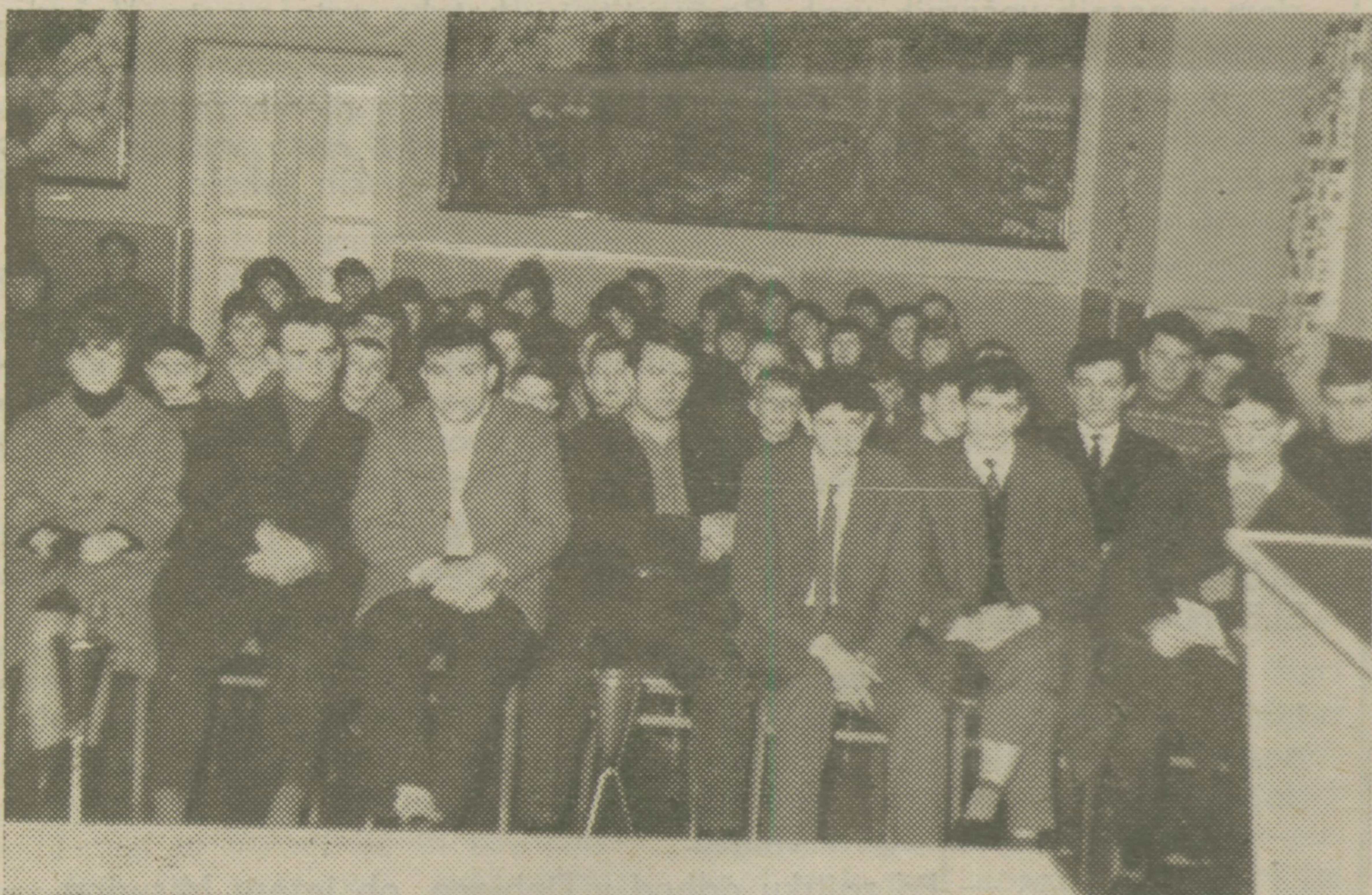
Mladi taborniki poslušajo poročilo

saj je v Podgradu že ustanovljena četa tabornikov. Tudi njihovo zastopstvo na občnem zboru je to pričelo. Načelnik čete v Podgradu pa je, kot vse kaže, garancija za uspeh.