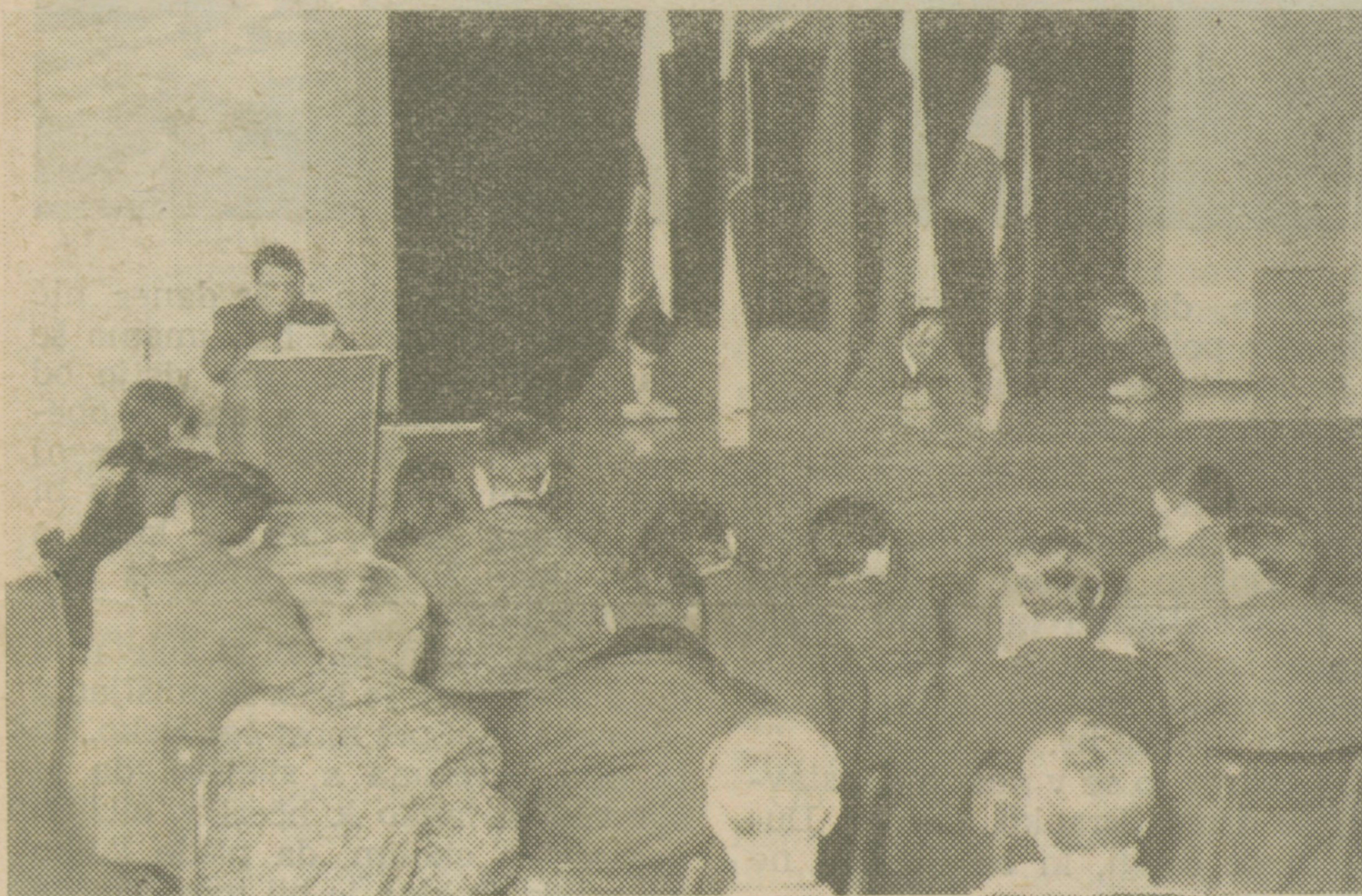
Z občnega zbora košarkarskega kluba »Lesonit«

1. Mladini posvetiti mnogo več pozornosti in organizirati na šo-