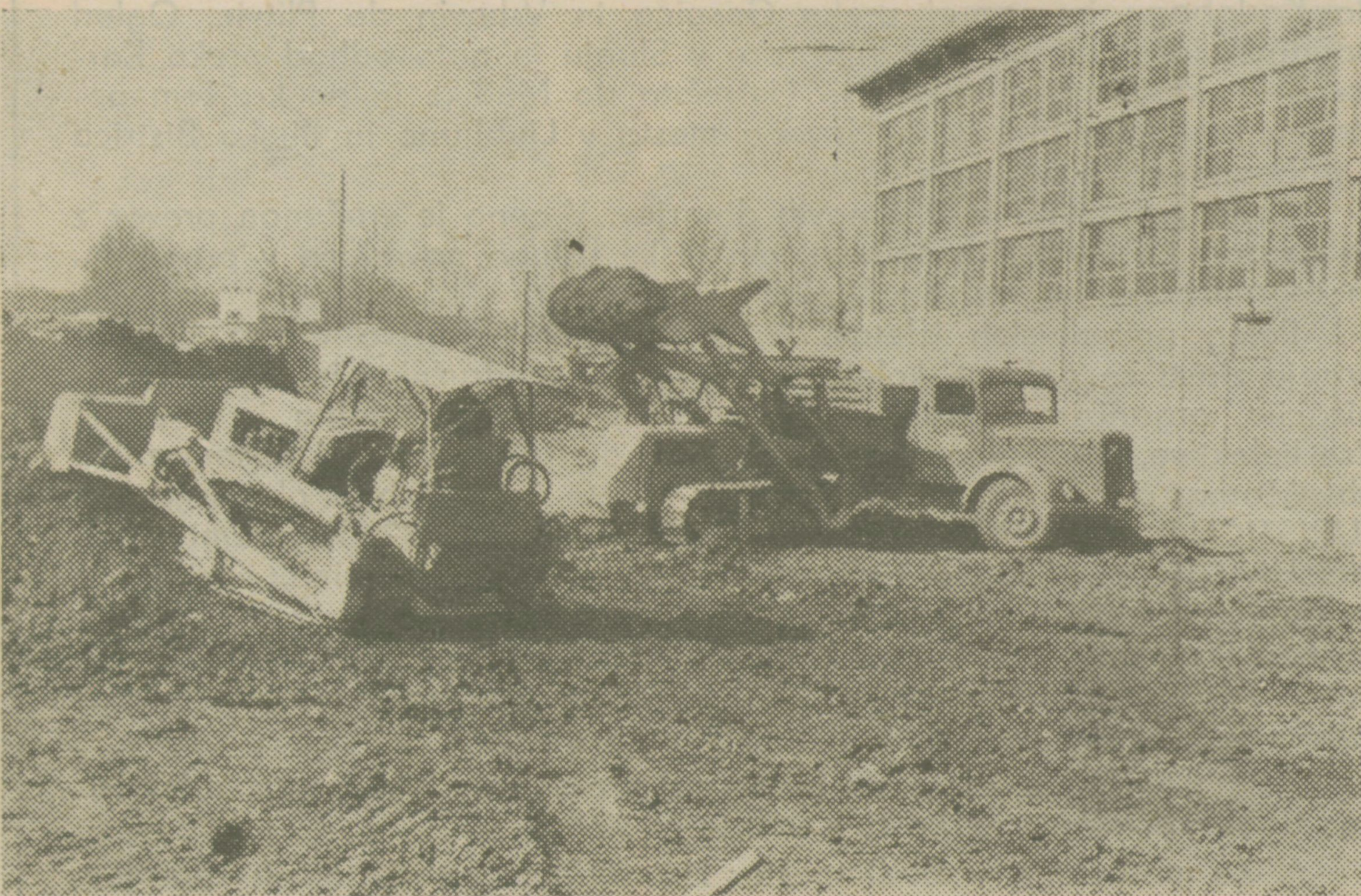
Ob novem skladišču planirajo zemlišče za industrijski tir in za razkladalni in nakladalni žerjav

Kolektiv Lesonita pa gre naprej po načrtani poti, vedno gradi, planira, širi svoj življenjski prostor.