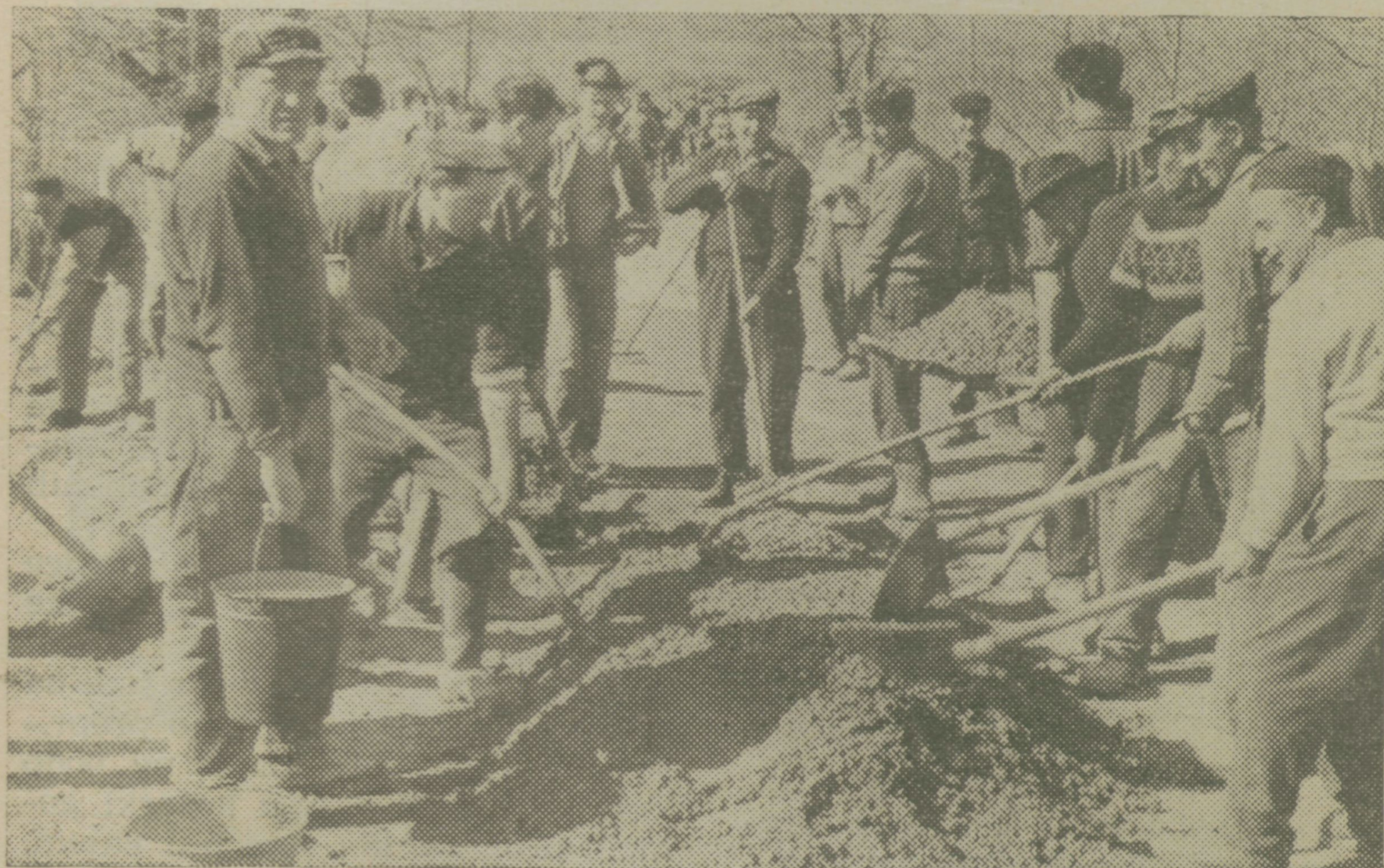
Vaščani pri prostovoljnem delu

Ne samo to, sklenili so, da bodo z napravami boljše gospodarili in tudi plačevali vodarino. Nič manj pomembna naloga, ki so jo skupno z vaščani Zabič, Kuteževa in Trpčan opravili v teh dneh, je zgraditev mostu čez Reko v vrednosti, ki presega nad dva milijona dinarjev. Zanimivo je, da se je udeležilo