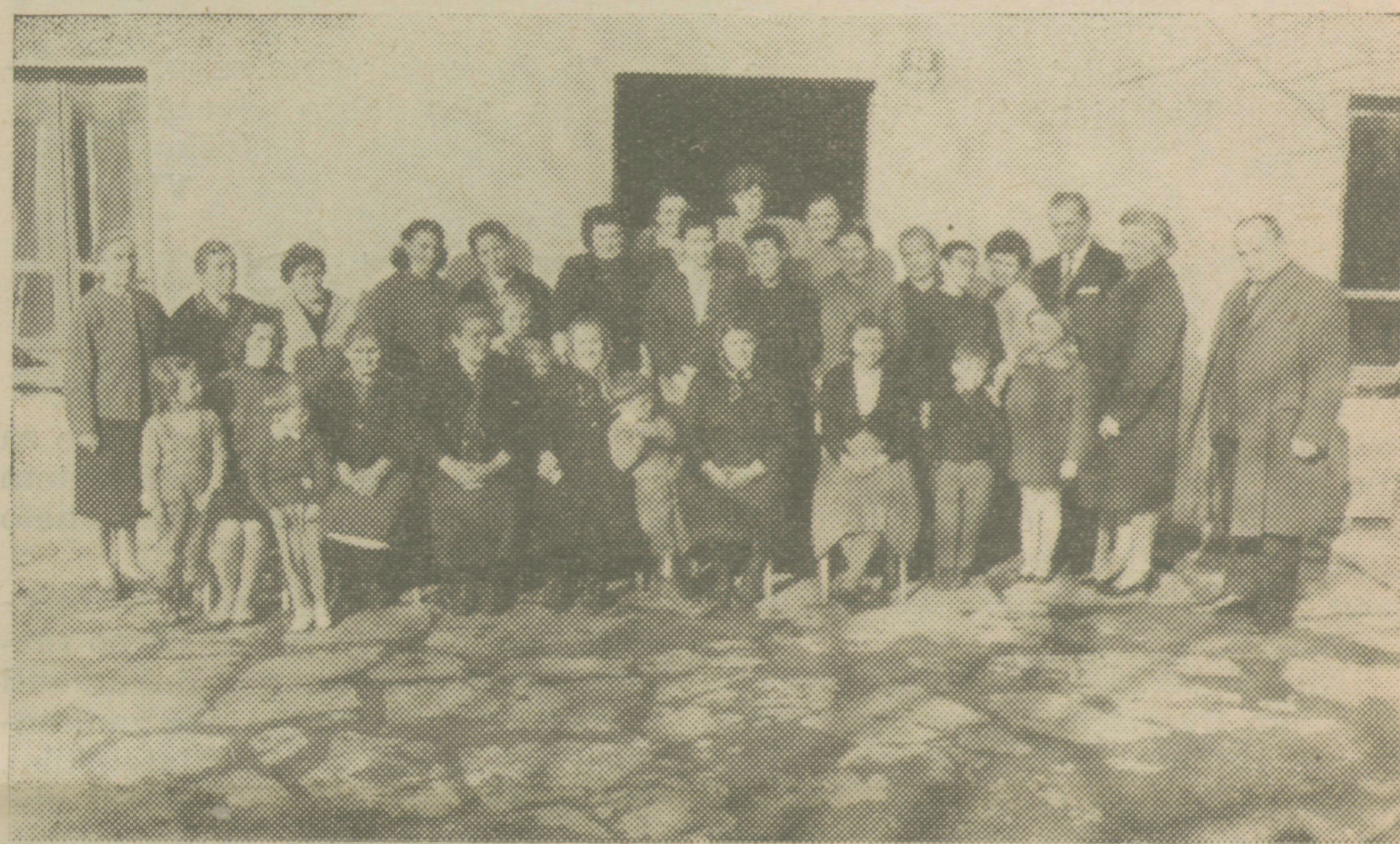
Dan žena v Podstenjah