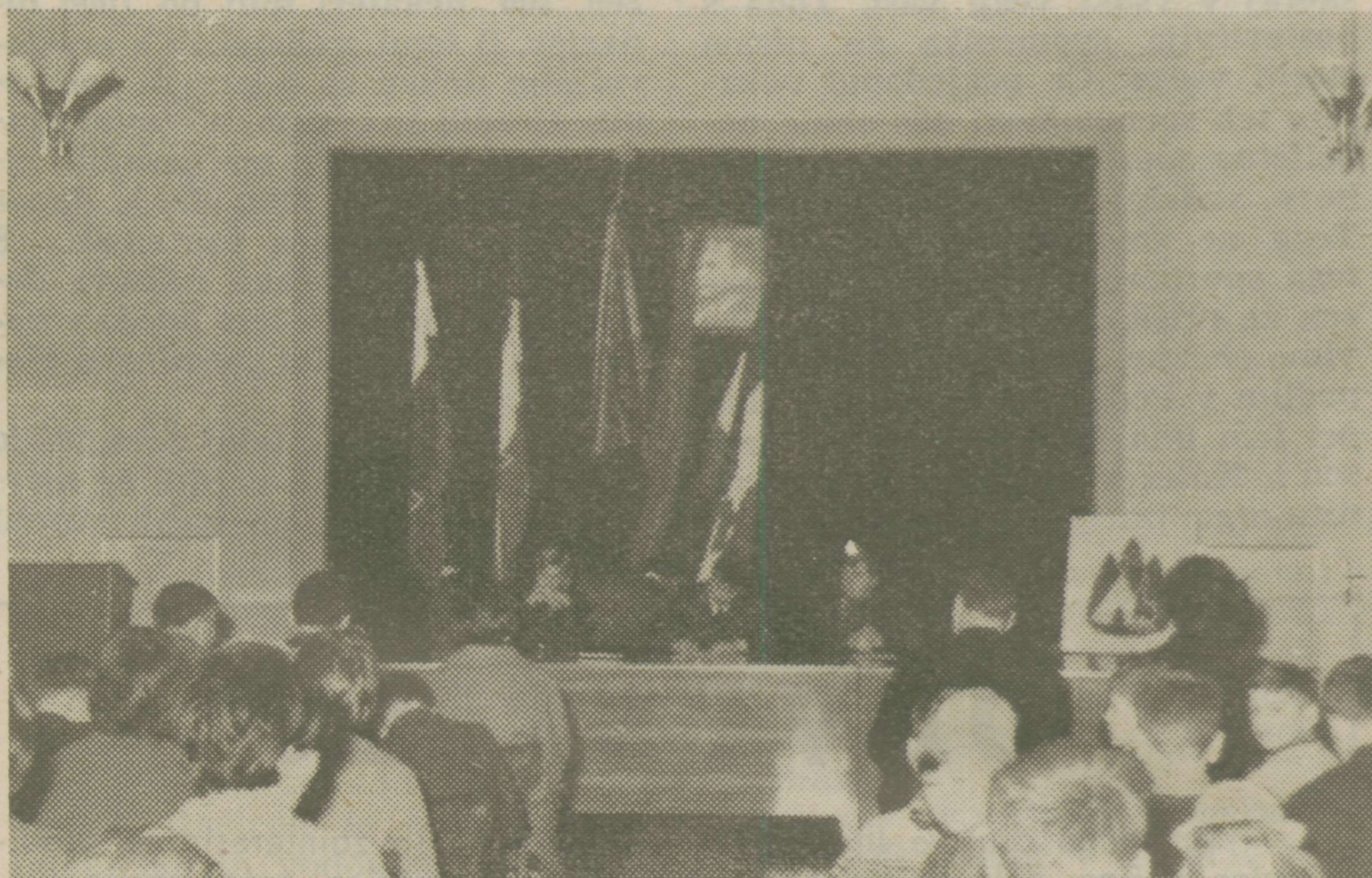
Z občnega zbora tabornikov

Vsem članom kolektiva Lesonit ob njihovem velikem jubileju iskreno čestitamo in želimo, da bi bili njihovi uspehi tudi v bodoče tako vidni kot doslej!