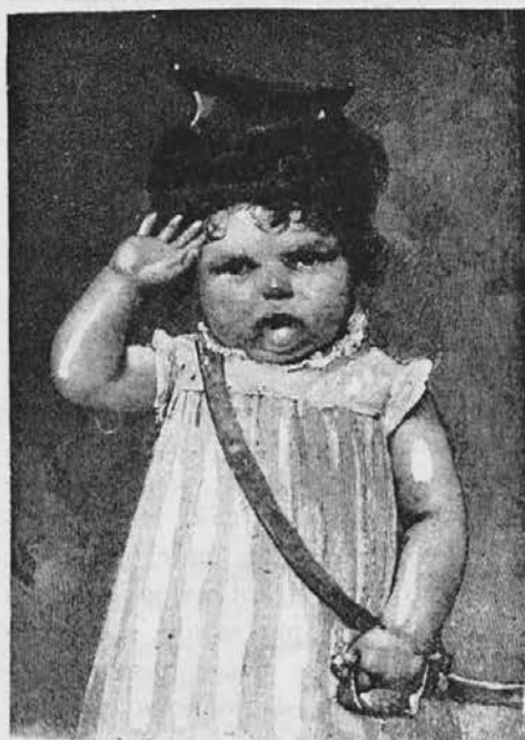
Veselo in srečno novo leto! Slovenskemu narodu v Ameriki in doma!