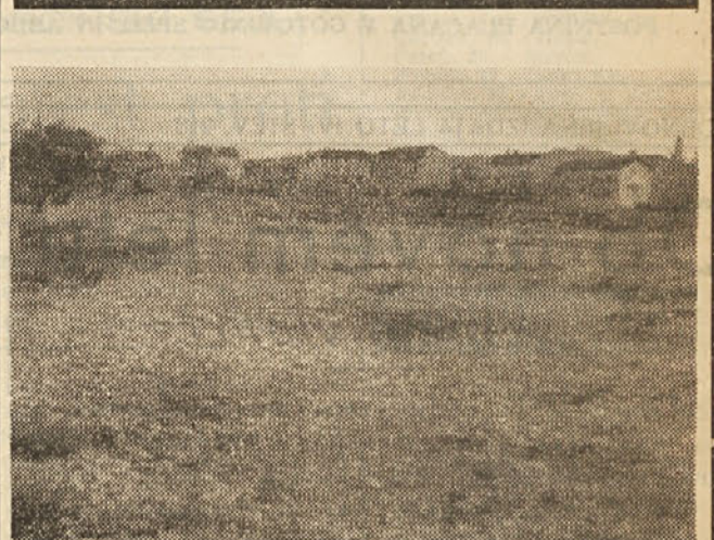
Ta prostor so kupili kriški ljubitelji ljudskega športa zato, da bodo na njem zgradili športno igrišče. Nične, razen njih, nima pravice do njega. Na njem si bodo uredili igrišče, klub oviram, ki jim jih delajo vojaške okupacijske in občinske oblasti.