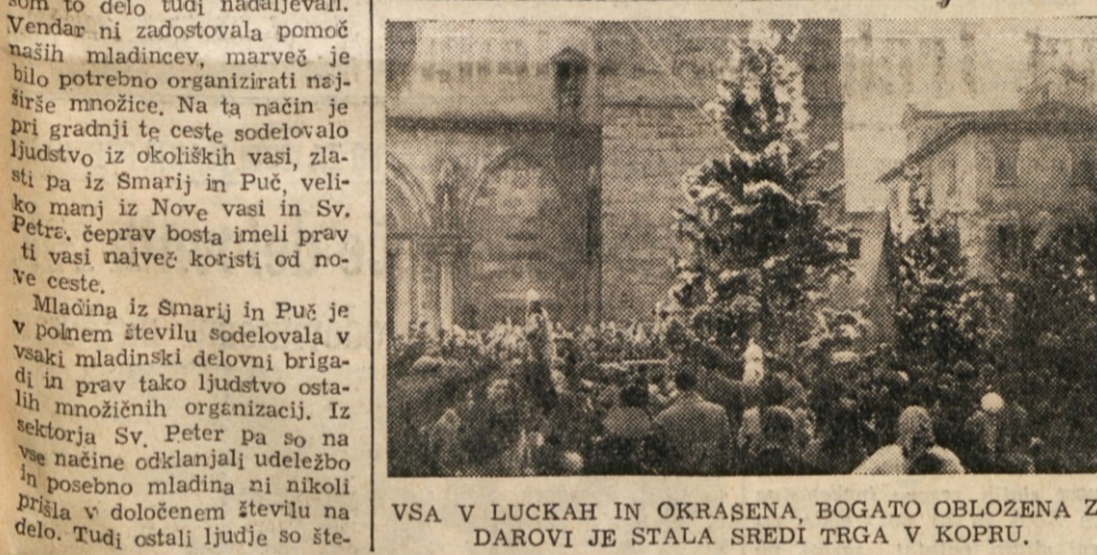
VSA V LUCKAH IN OKRAŠENA, BOGATO OBLOŽENA Z DAROVJI JE STALA SREDI TRGA V KOPRU.