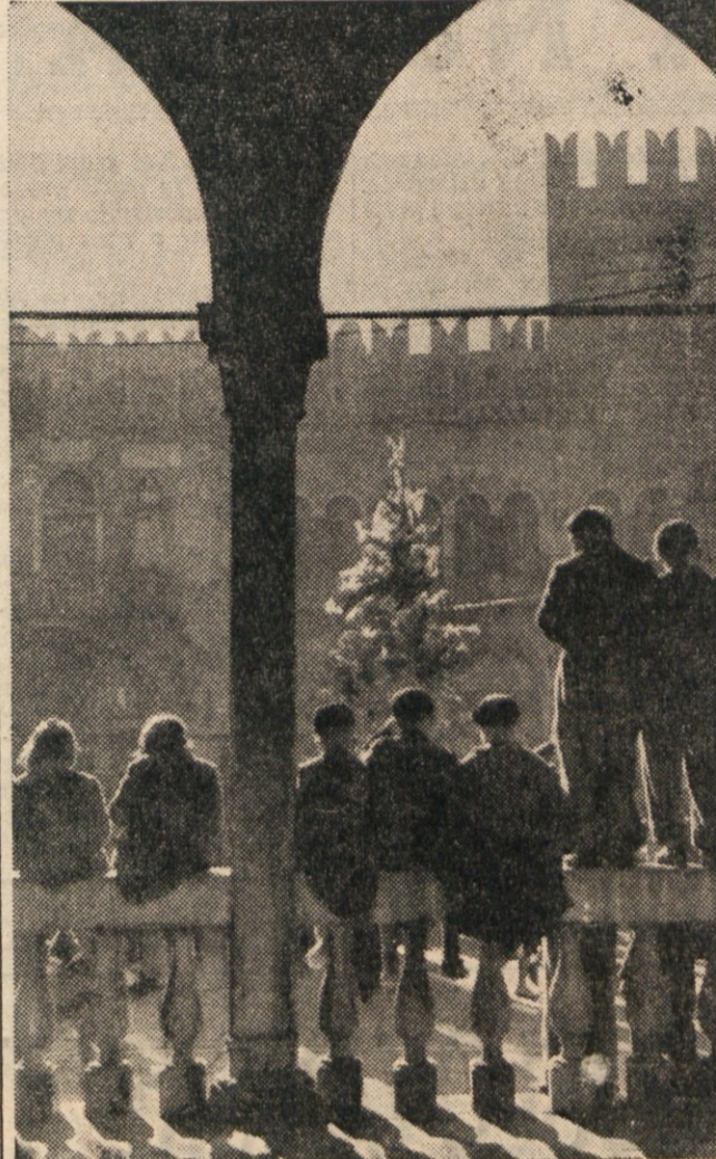
SREDI PRAVEGA GOZDA SMREK IN JELK NA TITOVEM TRGU V KOPRU SO PRESENECENI OTROCI ZAGLEDALI SKRATE, RDECO KAPICO IN MEDVEDA KOSMATINCA.