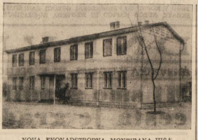
NOVA ENONADSTROPNA MONTIRANA HISA

Montažni način gradnje se v Jugoslaviji naglo razvija. Od tovarniške izdelave posameznih gradbenih elementov oziroma predizdelkov prehajajo že h gradnji montažnih stanovanjskih hiš. Petletni plan določa, da morajo v zadnjem letu petletke zagotoviti proizvodnjo montažnih stanovanjskih hiš v obsegu 460.000 kvadratnih metrov pokrite ploskve. Velikanska potreba po novih stanovanjskih prostorih, zlasti v novo nastalih industrijskih središčih narekuje uspešno razvijanje sistema montažnega načina gradnje in uspešno gradnjo tovarn za izdelavo montažnih delov stanovanjskih zgradb.