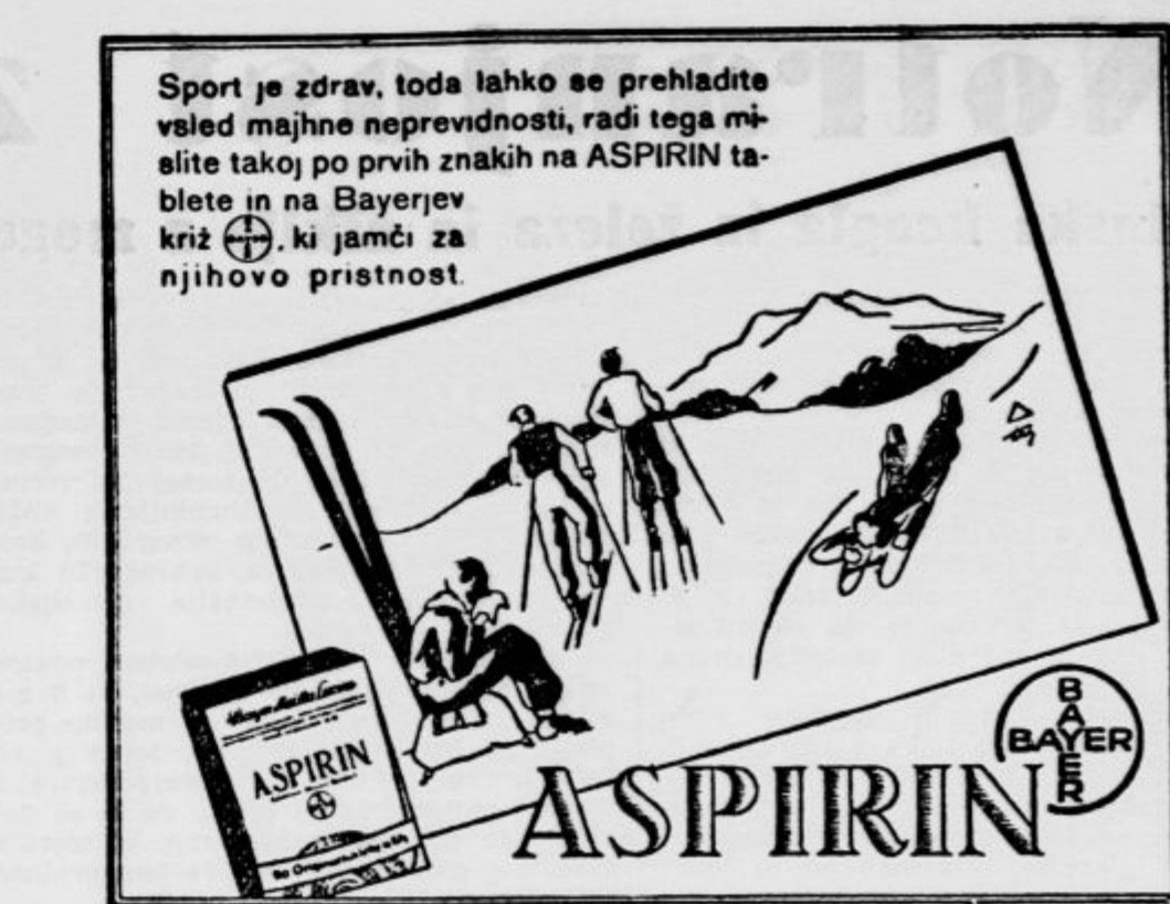
V. z. »JUGEFA« k. d. Zagreb, Opatje 32. Oglaš je registr. vod. S. br. 437 od 1. I. 1934.