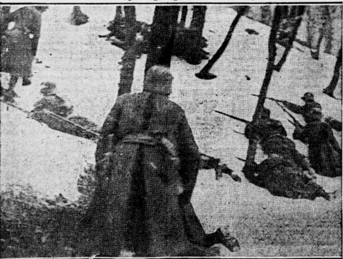
Obrambne čete, ki jih je avstrijski kancelar Dollfuss formiral za borbo proti nacističnemu terorju