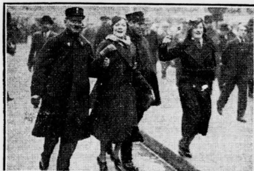
Pri demonstracijah pariških avtomobilskih izvoščkov so aretirali stražniki tudi te dame, ki so navzlic izvršenemu dejstvu židane volje