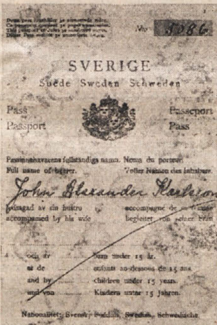
POTNI LIST, S KATERIM JE TOVARIŠ TITO LETA PRED NARODNOOSVOBODILNO VOJNO POD IMENOM ŠVEDSKEGA DRŽAVLANA JOHNA ALEXANDRA KARLSSONA POTOVAL PO INOZEMSTVU

Celo Tito je šel zelo daleč, da bi potolažil kremelskega diktatorja, toda dejstvo, da Rdeča armada v bistvu ni imela nobene vloge pri osvoboditvi njegove dežele, ga je podžigalo, da se je uprl ukazom, ki so bili očitno naperjeni zoper koristi njegovega naroda.