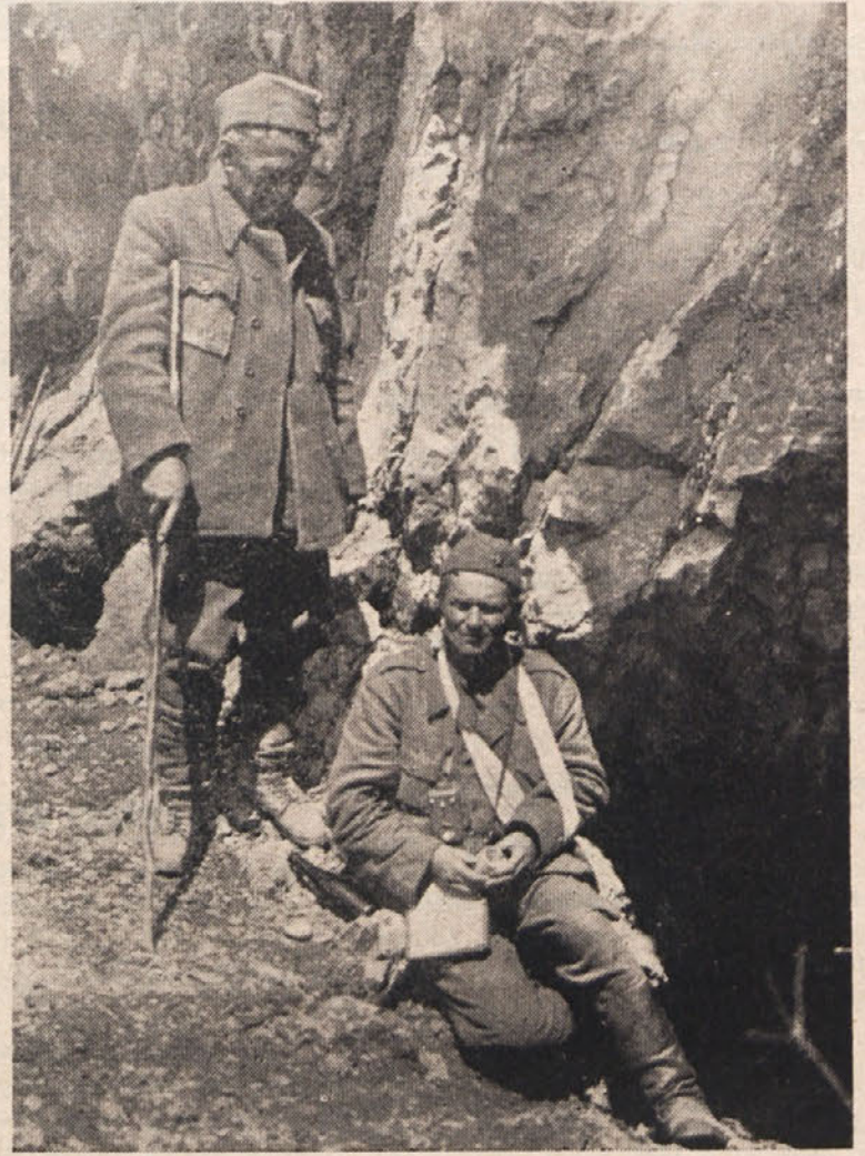
TITO V PETI OFENZIVI, SPOMENI LETA 1943, NEKAJ DNI POTEM, KO JE BIL RANJEN. POLEG NJEGA STOJI dr. IVAN RIBAR

Prvič, da v vseh deželah Jugoslavije povzdignejo dotedanja vojaška vodstva v glavne štabe, medtem ko se glavni štab preimenuje v Vrhovni štab narodnoosvobodilnih partizanskih odredov Jugoslavije.