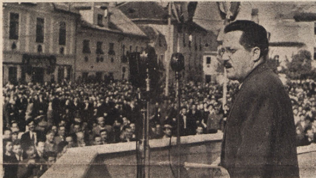
Nad 50.000 glava množica je vestno sledila in vzklikala tovarišu Kardelju med njegovim govorom na slavnostnem zborovanju v Kočevju

Povejte, da v samem mestu Trstu danes živi — po statistikah angloameriške vojaške uprave — poleg 50.000 Slovencev — 230 tisoč Italijanov, da pa ima vse ostalo ozemlje STO —