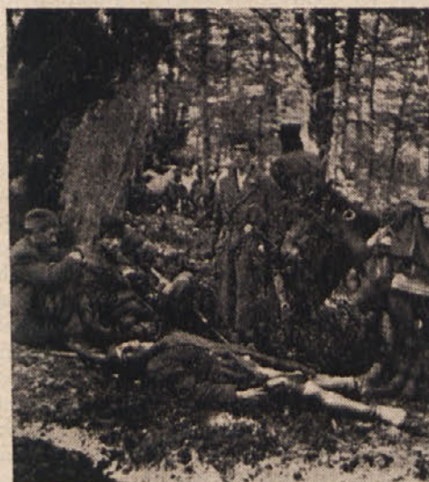
VSLED POMANJKANJA ZDRAVIL SO TUDI BOLEZENSKE EPIDEMIJE, ZLASTI TIFUS, RAZSAJALE MED PARTIZANSKIMI VRSTAMI

Četrtič, da se ustanovijo večje partizanske formacije, ne samo čete v odredih, temveč tudi bataljoni. Da se odredi izogibajo frontalnih bojev s sovražnikom, ki je po številu in strelnem orožju močnejši. Namesto tega je treba imeti med seboj dobro povezane številne, lahko gibljive in hkrati delujoče partizanske odrede. Ti odredi se bodo po dogovoru štabov, kadar bo potrebno, spojili v velike udarne enote, da bodo sprejeli vsiljeni boj, nato pa se bodo spet razbili in spet zadajali nepričakovane udarce sovražniku in objektom ter znova izginili s kraja napada. Poglavitno je ohraniti živo silo