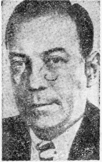
V New Yorku je bil z veliko večino izvoljen za župana demokratski kandidat Robert F. Wagner

3. TAFT-HARTLEYEV ZAKON. Skupnost »businessmanov«, ki so pomagali Eisenhoweru, da je prišel na oblast, je proti reviziji tega zakona, naperjenega proti stavkajočim. Eisenhower je sicer objavil spremembo tega protidelavskega zakona, toda v njegovi vladi o tem ni soglasja. Delavski predstavnik v vladi — minister za delo Durkin je zaradi nemoči v boju s svojimi kolegi podal ostanko Democ-