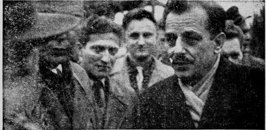
Državni sekretar Koda Popovič se vrnitvi s Dunaja med novi parji v Mariboru