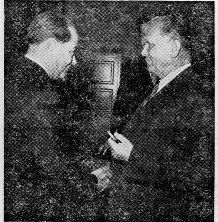
Predstavnik socialistične stranke Republike Španije pri predsedniku republike Ti tu

Prisotnost zahodnonemškega opazovalca na konferenci. London, 13. nov. (r). Zunanji ministar Eden je podal o spodnji zbornici novo pisemno izjavo na intervencijo o vmešanju Egipta v sudanske volitve. Eden pravi, da je egiptovska vlada skušala opipati na izid sudanskih volitev in da je samo o enem tednu poslala v Sudan 1000 uradnikov in pripadnikov vojske, deloma o uniformah. Ti uradniki so bili v Sudanu po egiptovski izjavi, na dopustu. V Chariumu se je mudil tudi egiptovski državni podtajnik za sudanske zadeve. Egipt je pošiljal v Sudan tudi denarne zneske. Eden pravi, da je britanska vlada kljub osemu potrpežljivo in sprajljivo vztrajala na svojem stališču, da zagotovi svobodno volitev in neodvisnost v Sudanu.