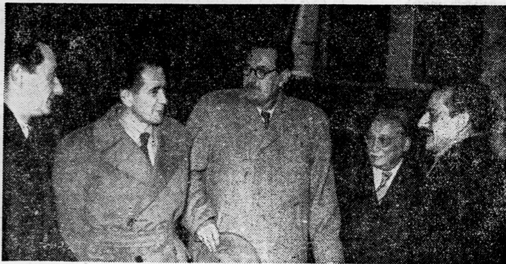
Ob vrnitvi iz Avstrije so drža vnega sekretarja za zunanje zadeve Kočo Popoviča na beograjski postaji sprejeli Milovan Djilas, Moša Pijade, Franc Leskošek, dr. Aleš Bebler in drugi