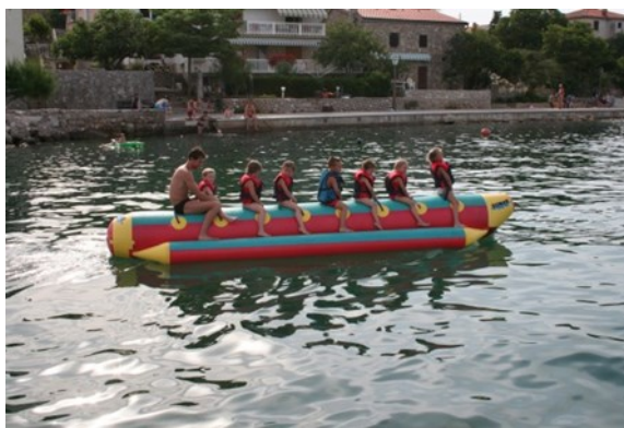
Aktivnosti, ki so jih imeli otroci na letovanju v domu domžalskih otrok v kraju Vantačiči, na otoku Krku

V drugi polovici avgusta so potekale pestre počitniške dejavnosti na Osnovni šoli Rodica. V Zvezi prijateljev mladine Domžale pa že razmišljajo, da bi v prihodnjih počitnicah za otroke, željne različnih radosti, vrata odprle tudi druge osnovne šole – ne le v občini Domžale, temveč v vseh občinah, ki jih s svojo dejavnostjo pokriva ZPM Domžale.