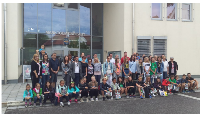
Pred občino v Wagni.

Hvaležni smo vsem, ki ste kakorkoli sodelovali in pomagali pri nastajanju in uresničevanju našega počitniškega programa.