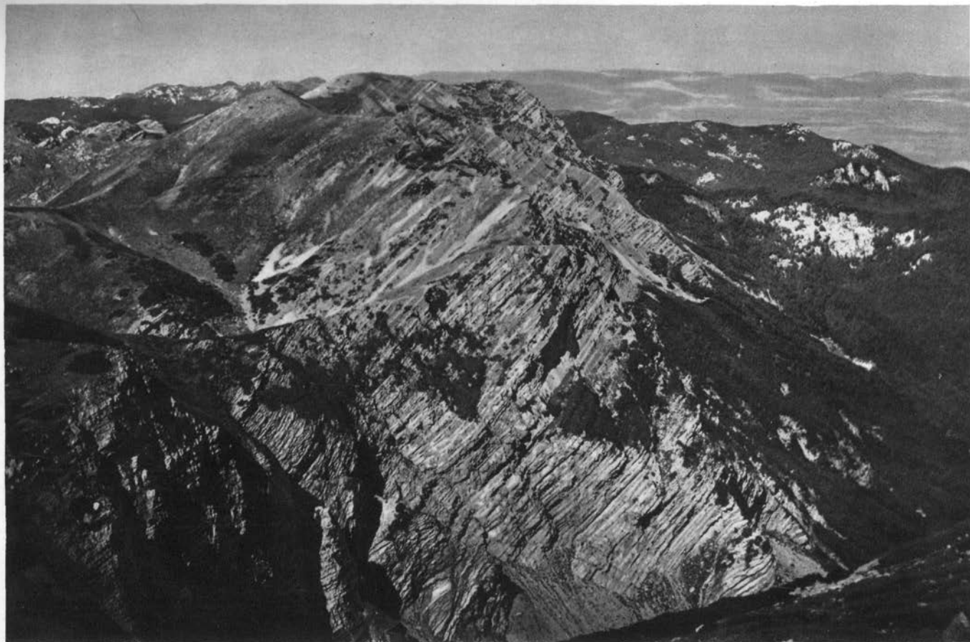
Velebit (od Visočice do Vaganskega vrha 1798 m)