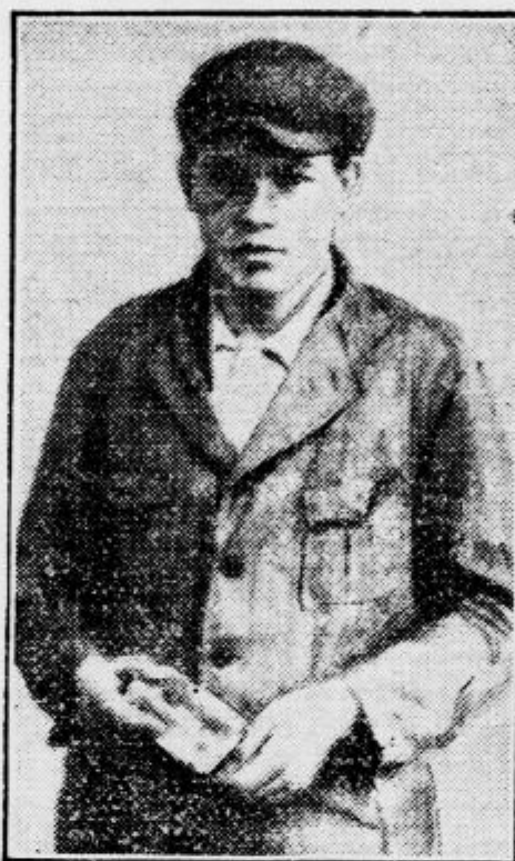
van der L'ebbe

holandski komunist, ki ga dolže požiga berlinske poslanske zbornice