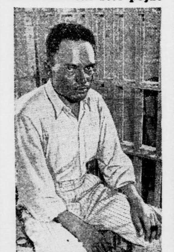
Italijan Zangara ki je izvršil napad na ameriškega predsednika Roosevelta in je pri tem hudo ranil čehaškega župana Cermaka. Ker je Cermak umrl, bo državno pravdnistvo obtožilo atentatorja premissljenega umora in za ta zločin predvidevajo predpisi smrt na električnem stolu