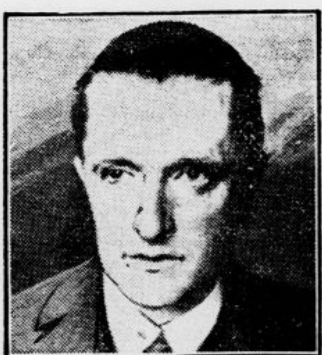
Nemški komunistični poslanec Torgler ki ga je zaprla nemška vlada zaradi požiga berlinskega parlamenta