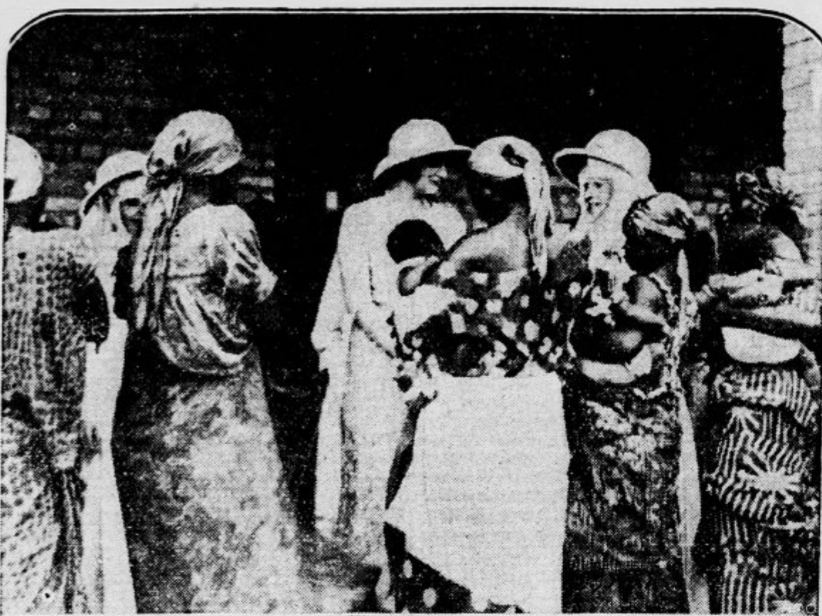
Belgijski prestolonaslednik Leopold in njegova žena princesa Astrid potujeta zdaj po Belgijskem Kongu, kjer je obiskala princesa žensko bolnico v Leopoldvilleu