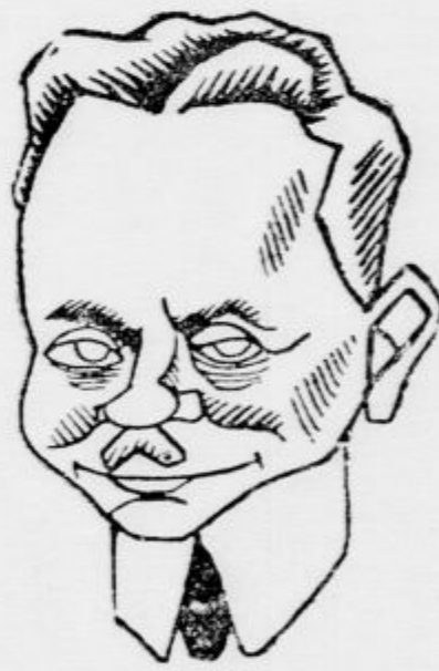
K državnemu puču v Avstriji Kancelar Dollfuss