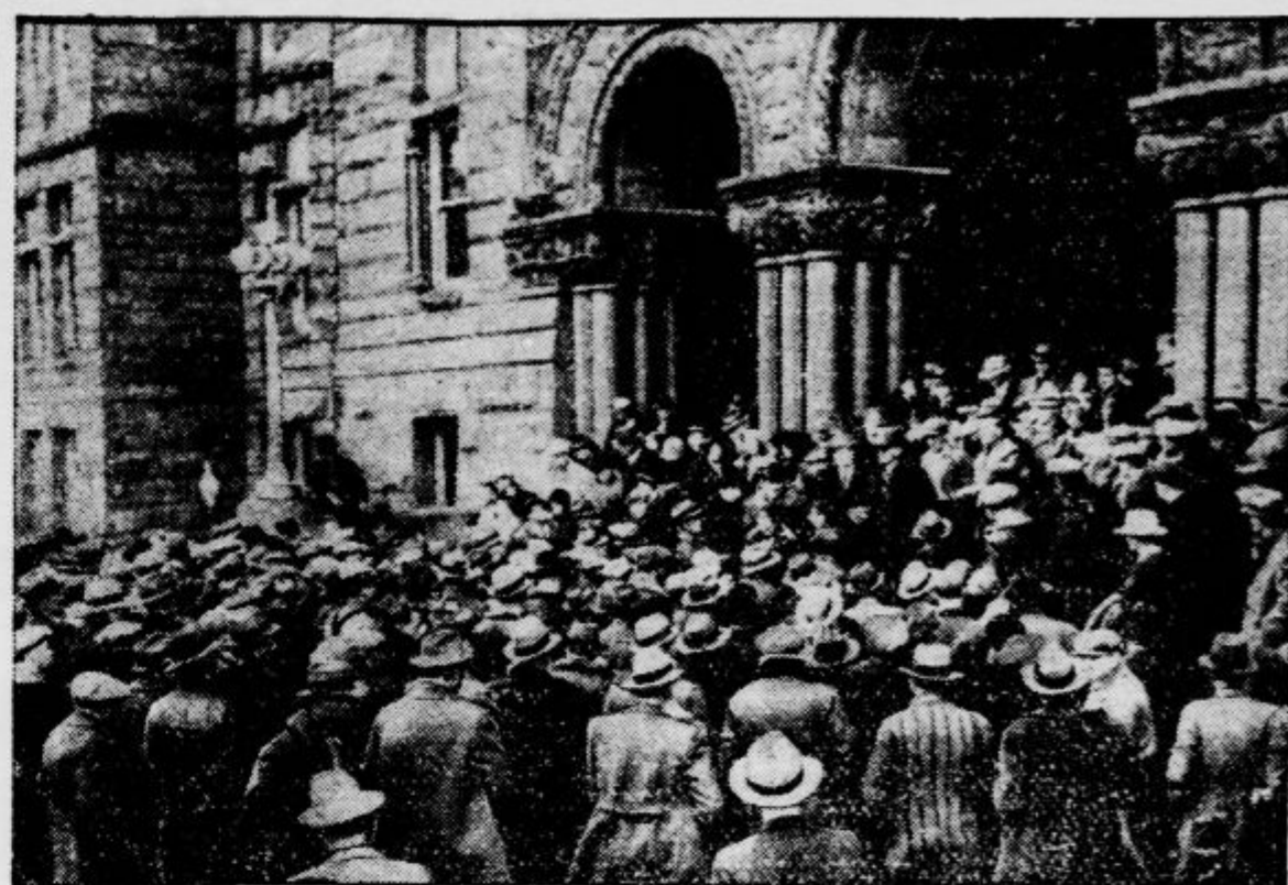
Zaradi bančne krize so navalili vlagatelji v Zedinjenih državah z vso silo na denarne zavode, od katerih zahtevajo svoje prihranke. Slika kaže takšen prizor v Salt Lake City (Utah), kjer je morala policija razganjati množico z bombami za solzenje