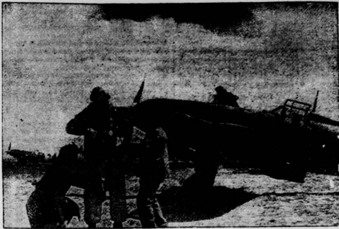
In una nostra base aerea in Tunisia: mentre vengono approntati i caccia per la partenza, i piloti completano la tenuta di volo... In una nostra base aerea in Tunisia: mentre vengono approntati i caccia per la partenza, i piloti completano la tenuta di volo...