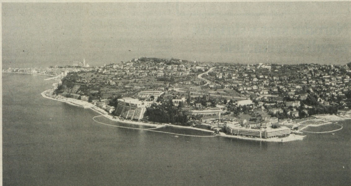
Na sliki je piranski polotok s Piranom, Bernadinom, delom Portoroža in Beljim križem – čudovite možnosti za nekaj oddiha!