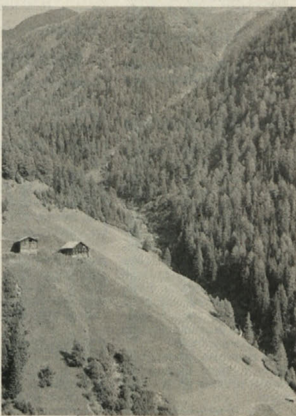
Senožet v Asternu

kovi koči“, je nujno, da še obiščemo eno uro peš oddaljeno že omenjeno razgledno točko planinsko postojanko Glocknerblick na vzhodnem pobočju melske doline. Od tam je tudi lepa priložnost za vzpon na severovzhodni razgledni vrh Mohar (2604 m). Pot nanj je v začetku do Moharkreuz (mogočen križ) na višini 2451 m nekoliko strma, nato pa bolj položna. Z vrha je izredno lep razgled na Großglockner, Šobrovo in Zadnikovo skupino in na z večnim snegom obdani Sonnblick. Vračamo se lahko po drugi poti v severovzhodni smeri do sedla Göritzer Törl (2463 m) in nato naravnost proti jugu do Zadnikove kočice. Za to krožno pot bomo rabili 4 in pol do 5 ur hoje po sorazmerno lahkem terenu. Obiščite ta svet, ne bo vam žal!