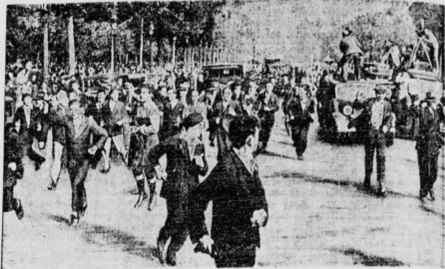
Med proslavo Device Orleanske v Parizu je prišlo do spopada med desničarskimi organizacijami in komunisti. Posegla je vmes policija. Naša slika nam kaže buren prizor v ulice Avenue des Champs Elysees