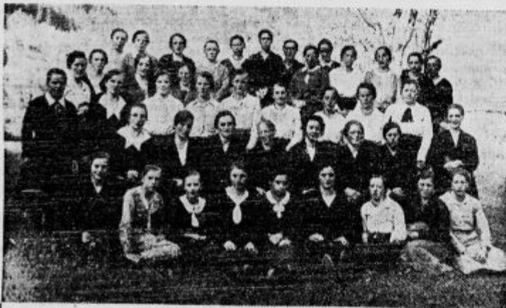
Dežeta, ki so se udeležila domačih duhovnih vaj v Lomu nad Tržičem

Vodstvo zavoda sv. Stanislava v St. Vidu nad Ljubljano.