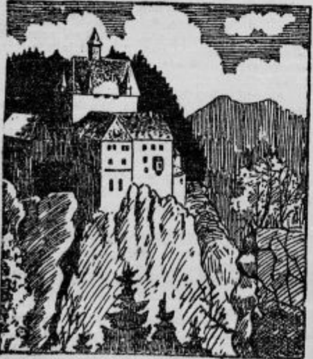
Kje je graščak?

Slučajno zadel. Gostilničar z dežele, ki je rad veljal za izobraženega, je rabil tuje besede. Pri tem se je pa seveda zelo velikokrat uredal. Nekega dne je prišel v banko in nagovoril ravnatelja: »Gospod bankroter...« Takoj mu odgovori ravnatelj: »Zaenkrat še nisem, lahko se pa zgodi.«