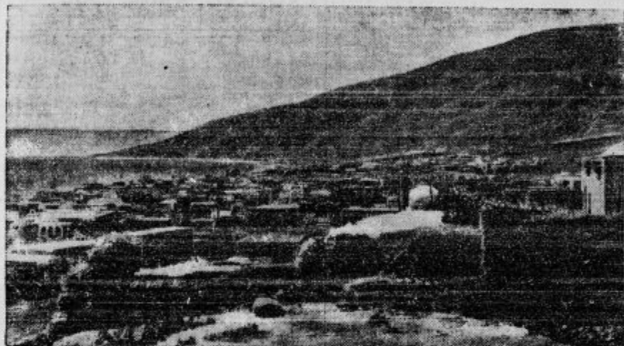
Tiberija ob Genezareškem jezeru.

Nova nevihta je preprečila reševalno delo, ki je bilo v polnem teku. Nedeljskim žrtvam so se pridružile nove. V mestu je vse narobe. Prihitelo je 1500 vojakov, ki s pomočjo policije rešujejo, kar se rešiti da. Prebivalstvo je po večini zapustilo mesto in tabori na prostem.