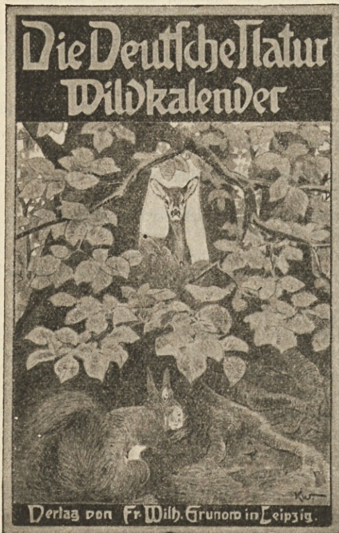
«Die deutsche Natur.»

Die Alpenflora hat von jeher das besondere Interesse aller Menschenkinder erregt, welche sich im rauhen Kampfe ums Dasein die Freude an der Natur und ihren Schöpfungen bewahrt haben. Nur kurz ist das Dasein der Alpenblumen, aber um so größer die Pracht und der zauberhafte Reiz, in denen sie sich ansleben. Naturdenkmäler im besten Sinne des Wortes sind sie, um deren Schutz man sich neuerdings mit Recht und einigem Erfolg bemüht. — Eine hübsche und