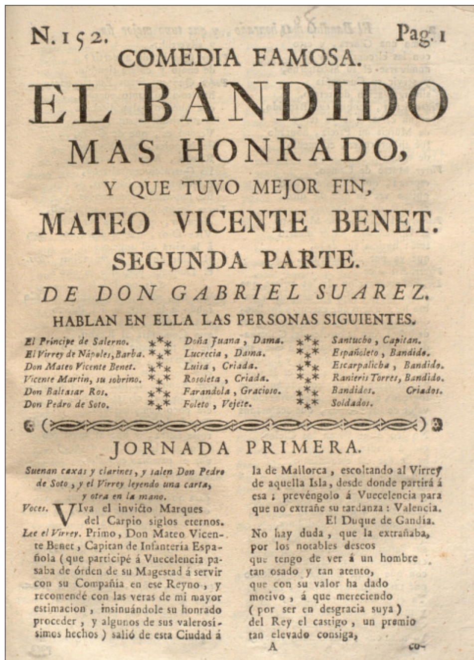
Figura 3: Suárez, Gabriel, El bandido más honrado y que tuvo mejor fin, Mateo Vicente Venet. Valencia, Josep Orga imp, 1769.

Mateu Benet y estava reputada en tot lo poble per l'arco ilis de les bregues" [porque la abuela tenía más nombre que Mateu Benet, y era tenida por el pueblo como el arco iris de las disputas] (Ros, 1769, 27). Por su parte, en 1809, el Col·loqui trilingüe o col·loqui