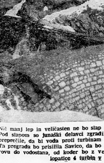
Nič manj lep in veličasten ne bo slap Savice, čeprav je danes ukročena. Pod slapom so junaški delavci zgradili pregrado in vse naprave, ki bodo preprečile, da bi voda proti turbinam nosila tudi kamenje, pesek in drevje. Ta pregrada bo prisilila Savico, da bo odtekala po 2 km dolgem dovodnem rovu do vodostana, od koder bo z veliko silo padala 225 m globoko na lopatic 4 turbin v strojnici ob Savici

Na Savici se bo danes zavrtel eden izmed dveh agregatov naše nove, pravkar dograjene visokotlačne hidrocentralne. Veliki, 20 ton težki generator za to hidrocentralo je izdelal slovenski kolektiv tovarne »Rade Končar« v Zagrebu. Gnala ga bo z vsake strani pa ena Peltonova turbina. Ta dvočlenski kompleks »2200 konjskih moči. Obe turbini kakor tudi dve enaki za drugi agregat so izdelali v »Litostroj«.