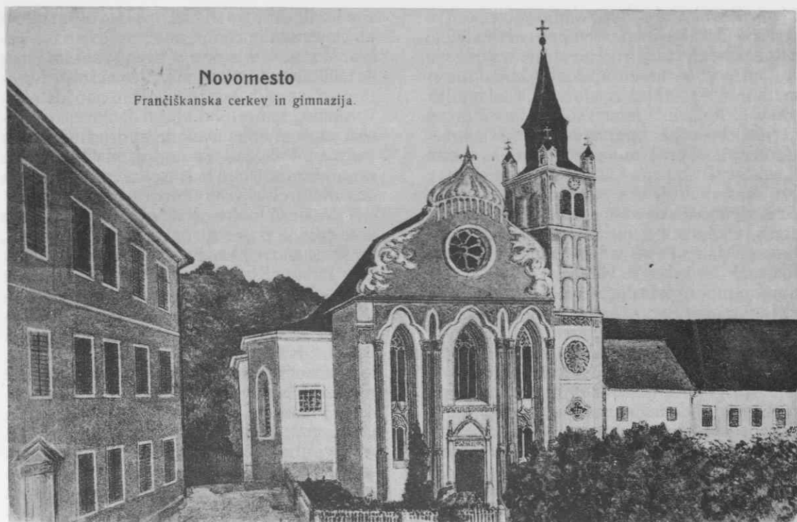
Frančiškanska cerkev in gimnazija v Novem mestu, razglednica iz leta 1908 v Narodnem muzeju v Ljubljani

Leipzigu, Darmstadtu, Frankfurtu, Kölnu in v Wagnerjevem gledališču v Weimarju. Prepeval pa je tudi v dunajski dvorni operi. Uveljavil se je še kot režiser in se izkazal v gledališčih v Colmarju, Essenu in Gdansku. Leta 1918 se je vrnil v Ljubljano in postal prvi režiser ljubljanske opere. Nekaj let je poučeval tudi solo petje na šoli Glasbene matice v Ljubljani, a je moral zaradi bolezni prenehati. Umril je 25. novembra 1926.