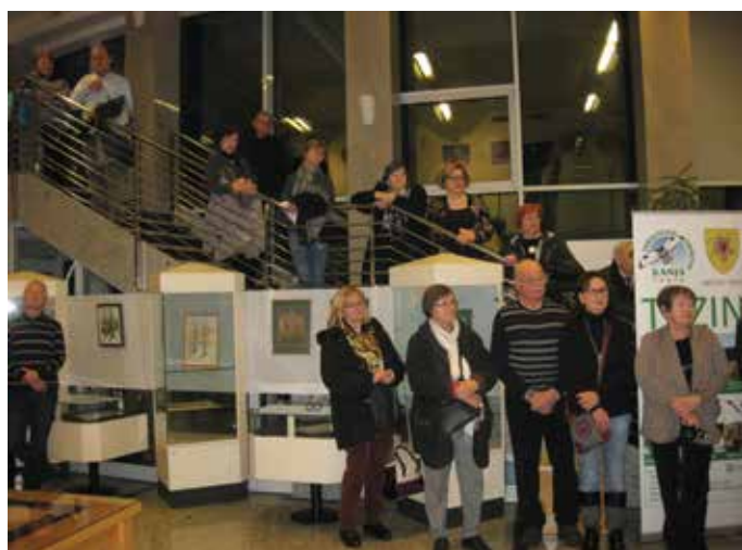
Šilarjeva se je množici obiskovalcev prisrčno zahvalila za obisk.