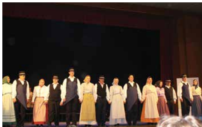
Na območnem srečanju folklornih skupin v Mengšu so se predstavili tudi naši folkloristi iz skupine Trzinka, člani in poželi velik aplavz.