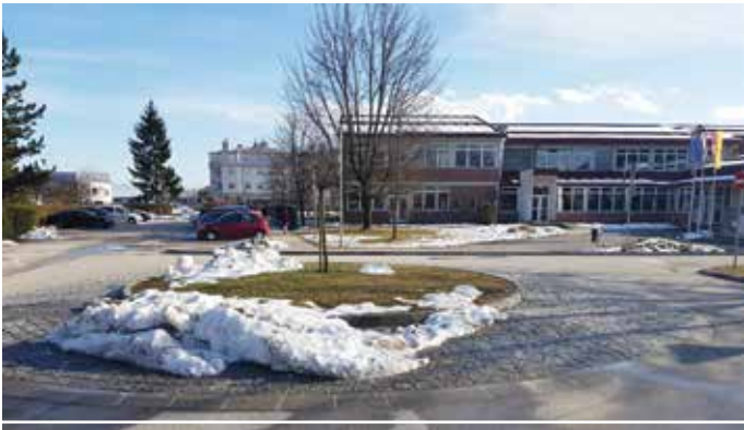
V Trzinu se bo tudi letos, enako kot lani, precej prenavljalo prometno infrastrukturo. Na fotografijah sta lanski tovrstni pridobitvi, križišče pred šolo (zgoraj), in novi izvoz iz Mlak (spodaj).