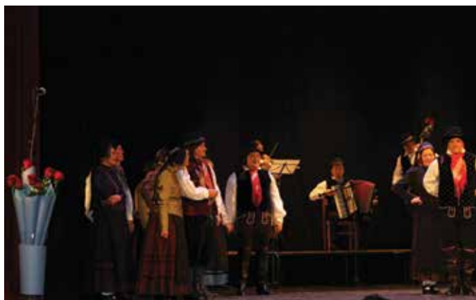
Odlični nastop trzinskih folkloristov veteranov, ki so navdušili v vseh pogledih.