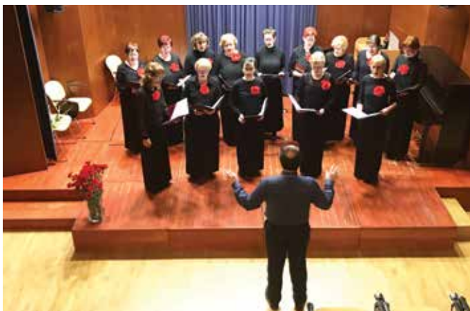
Utrinek s proslave – nastop ženskega zbora Trzinke