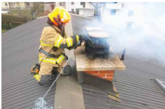
Prebijanje dimniške tuljave med požarom