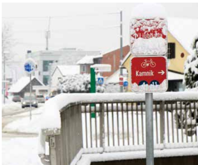
Trzin je imel zimsko podobo letos tudi v začetku marca. Sodeč po kolesarskih znakih je bila pot v smeri prestolnice bolj zasnežena kot proti Kamniku.

Na koncu še par »sladkorčkov«, povezanih z mrazom, kakršen nastopi – sodeč po vremenski statistiki – le nekajkrat na stoletje.