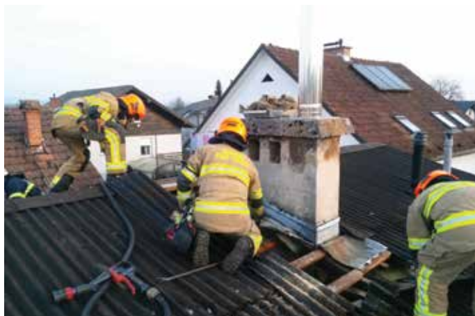
Odpiranje okolice dimnika in odstranjevanje odgorelega materiala