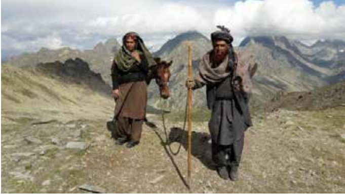
Divji pastirski par iz Kašmirja