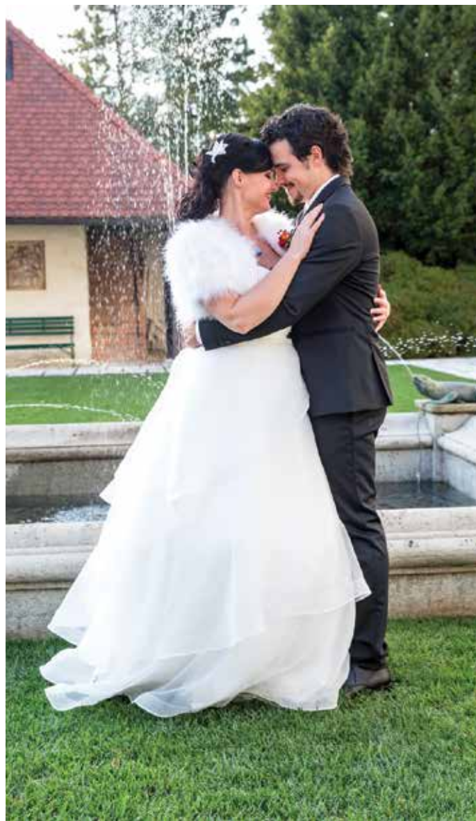
Utrinek s prelepe poroke na gradu Strmol

Za njo je bilo že deset let uspešne operne kariere, ko je nastopila na slovenskem izboru za pesem Evrovizije. S pesmijo Cvet z juga je prepričala domačo javnost in odpotovala v Helsinke in se tam uvrstila v superfinale, Sloveniji pripela 15. mesto in bila izbrana za najboljši vokal. »Na Evroviziji so takrat prvič poslušali pesem, ki je bila kombinacija popa in opere,« se spominja. Na vprašanje, ali bi še kdaj pela na Evroviziji, takoj izstreli, da ne: »To je za mlade ljudi, saj je zelo naporeno. Tu so pričakovanja naroda, številne pogodbene obveznosti do