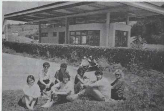
Že na varnem v Avstriji

Čakal nas je pester program: lektorske vaje, spoznavanje novosti v slovenskem pravopisu, seznanili so nas z metodi- ko poučevanja pri predmetu spoznavanje okolja, s slovensko skladnjo, oz. z analizo stavka in povedi, z novostmi v slovenski mladinski književnosti, z delom v dramskem krožku na OŠ, z uporabo lutk v vrtcu in na razredni stopnji OŠ,