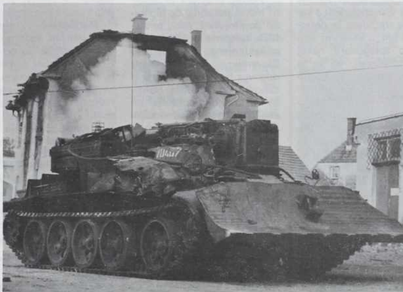
Tanki so odropotali. . . Se bodo vrnili?