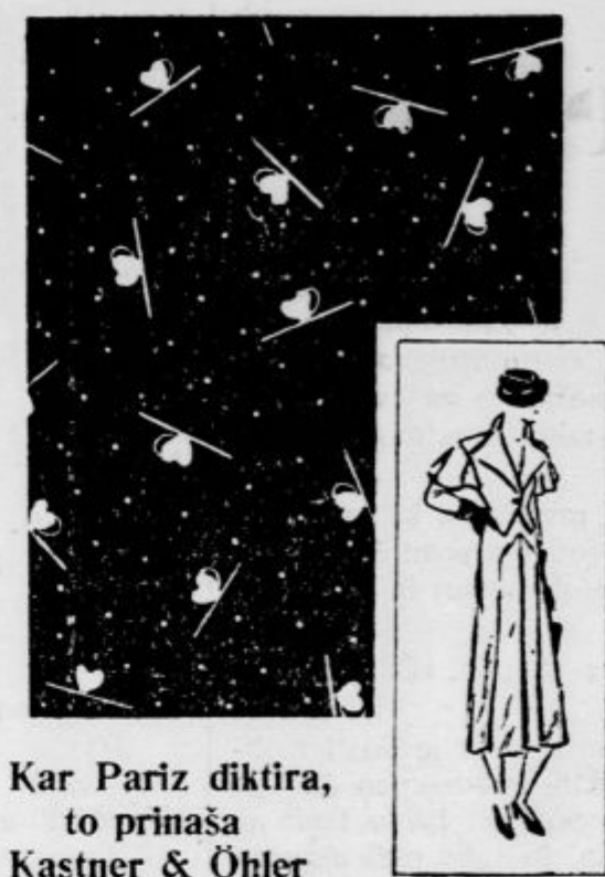
Kar Pariz diktira, to prinaša Kastner & Ohler

BEOGRAD 15: Prenos iz Saborne cerkve. — 20: Cerkevni koncert. — 21: Plošče. — ZAGREB 19.30: Delni prenos Wagnerjevega »Parsifala«. — PRAGA 19.25: Stara velikonočna poezija. — 20.10: Igra. — 20.45: Violinski koncert. — 21.15: Operna glasba. — BRNO 19.25: Koncert iz Prage. — 20.15: Koncert moškega pevskega zbora. — VARSAVA 18: Večerni koncert. — 20: Skrajšan Wagnerjev »Parsifal«. — 21.40: Prenos cerkvene koncerta. — DUNAJ 17: Orkestralni koncert. — 19.10: Rendlov »Pasion«. — 20.30: Mozartov »Requiem«. — BERLIN 19: Bachov »Matejev pasion«. — 22.30: Prenos cerkvene koncerta — KÖNIGSBERG 19: Prenos iz Berlina. — 22.20: Prenos III. dejanja »Parsifala« iz gledališča. — MÖHLACKER 19: Prenos iz Berlina. — 20.30: Brahmov »Nemški requiem«. — 21.45: »Smrtni ples«.