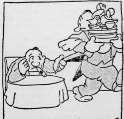
»Gospod plačniki! Postrežite mi vendar z vžgalico!«