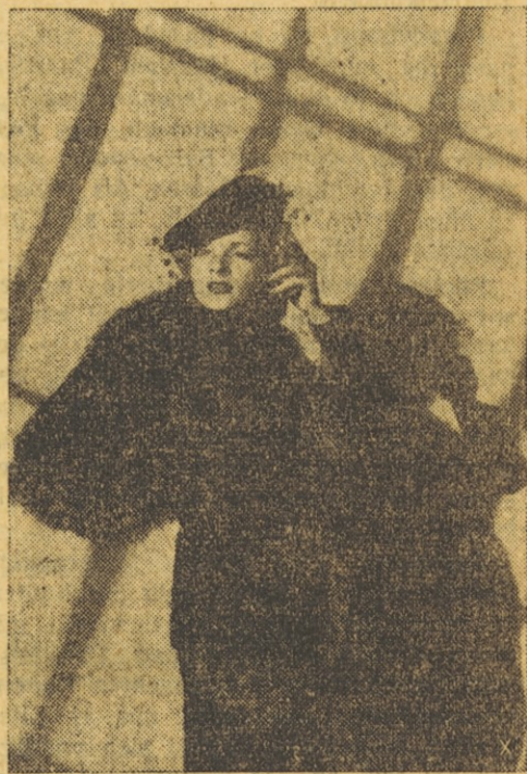
Ein Berliner Pelzhaus bringt für den Herbst eine elegante Silberfuchsecharpe. Eine äußerst graziöse Linienführung der Pelzverarbeitung in Form einer Spirale.

1/4 kg Mehl, 1 Ei, 17 dkg Zucker, ein Päckchen Backpulver, etwas kalte Milch,