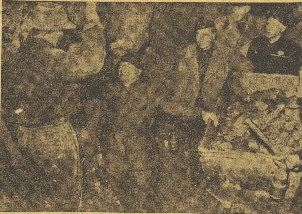
Während seiner Reise durch Norditalien, bei der der Duce verschiedene motorisierte Divisionen besichtigte, besuchte er auch eine Erzgrube. — Unser Bild zeigt ihn tief im Schacht im Gespräch mit einem Bergarbeiter.

waren insgesamt fünf Verletzte zu verzeichnen. Ferner wurden Decamera, Asmara, El Uak und El Gaba in Somali angegriffen, doch wurde kein Schaden verursacht.