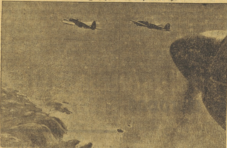
Eine Kette deutscher Heinkel-Kampfflugzeuge He. 111 steuert auf ihr Ziel zu.