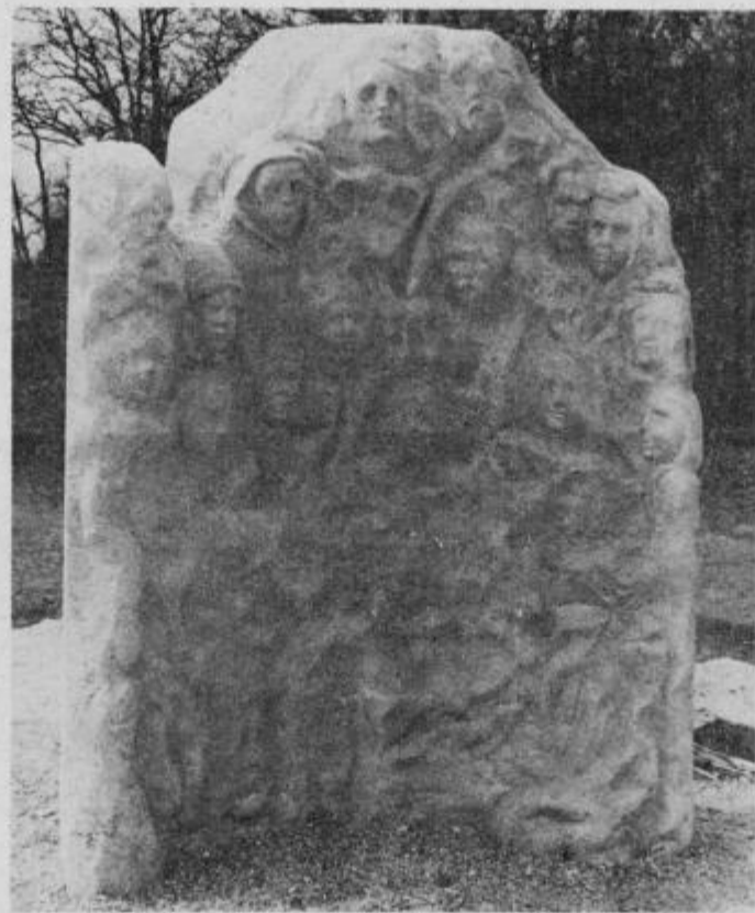
Plastika — delo kiparja Branka Zorca ob pomoči mladih likovnikov iz ptujkega kluba mladih