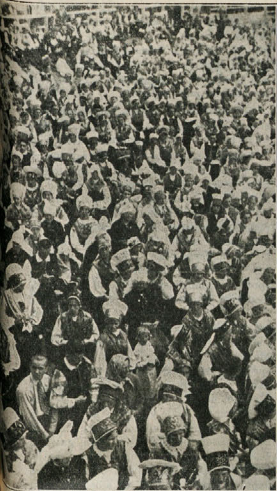
Narodne noše na Stadionu

Kaj je naredilo na ljudi največji vtis, je težko reči, ker se je vrstil dogodek za dogodkom, drug od drugega zajemljivejši. Romanje Marije Pomagaj, Njen prihod na Stadion (takrat je bilo sleherno oko rosno), skrivnostna moška polnočnica, prihod in slovenski govor papeževega odposlanca, mogočno petje velikega zbora, še bolj skupno petje 100.000-čere množice, veličastna popoldanska procesija, sklepni blagoslov, ki ga je podelil kardinal z Najsvetejšim