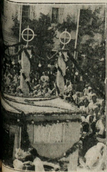
Križ v Trzinu.

Kaj je naredilo na ljudi največji vtis, je težko reči, ker se je vrstil dogodek za dogodkom, drug od drugega zajemljivejši. Romanje Marije Pomagaj, Njen prihod na Stadion (takrat je bilo sleherno oko rosno), skrivnostna moška polnočnica, prihod in slovenski govor papeževega odposlanca, mogočno petje velikega zbora, še bolj skupno petje 100.000-čere množice, veličastna popoldanska procesija, sklepni blagoslov, ki ga je podelil kardinal z Najsvetejšim