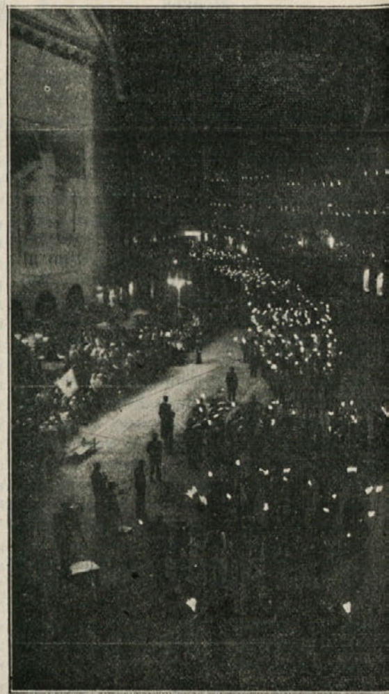
Možje in fantje pri nočni procesiji

Za odrasle smo oddali 500 izkaznic, mnogo jih je kupilo šole v Ljubljani, ker nam jih je tukaj zadnji dan zmanjkalo. Je povsod ista izkušnja, da se velik del ljudstva šole zadnji trenutek odloči. Splošno je prav malo ljudi, da bi se sploh nič