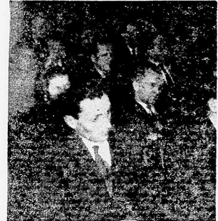
Z večerajšnje razširjene seje Prešernove družbe v Klubu poslancev v Ljubljani. — Poročilo berite na 4. strani

Zvezni izvršni svet se havi nato v svojem poročilu z delom svojih organov, z organizacijo in problemi državne uprave, kakor tudi z delom in problemi republikanskih uprav, uprav in svetov ljudskih odborov ter ustanov s samostojnim finančnim