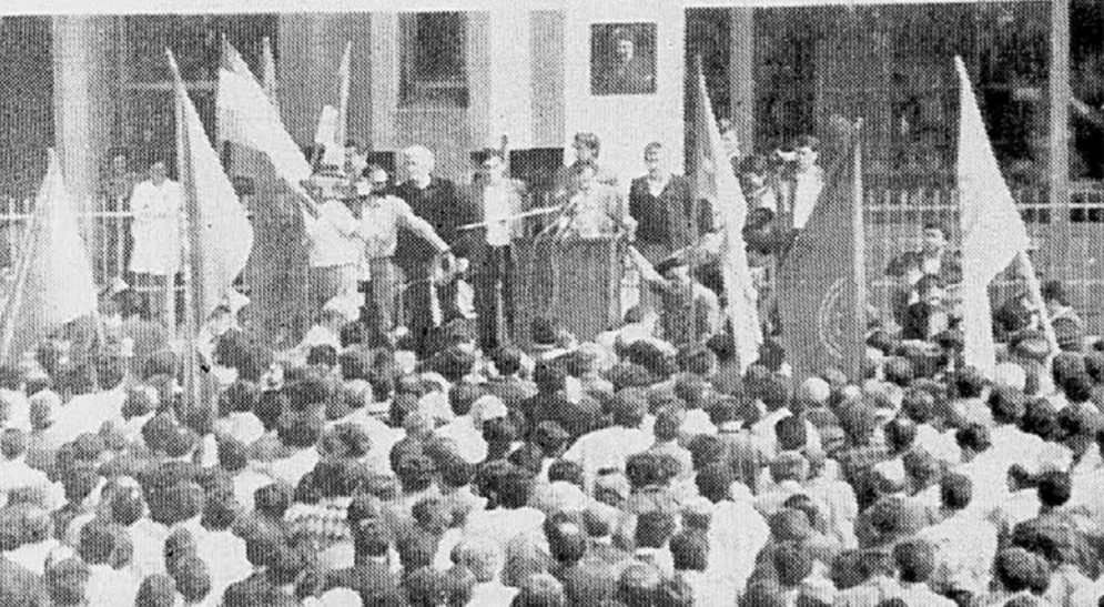
PROTEST V RAKOVICI — Pod geslom »Delavci Jugoslavije, združimo se« so se delavci tovarne 21. maj zbrali na tovarniškem dvorišču, da bi podprli zahteve mestnega sindikalnega sveta Beograd in hkrati ostro protestirali proti splošnim razmeram v državi.