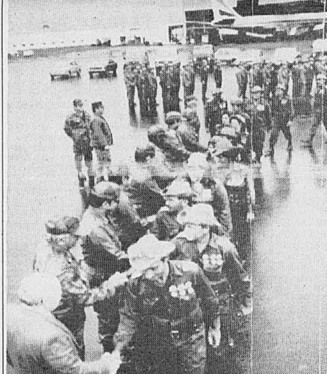
Kubanski vojaki zapuščajo Etiopijo ADIS ABABA, 13. septembra — Kuba se je odločila, da dokončno umakne čete iz Etiopije. Havana jih je tja kot »internacionalistično pomoč« poslala že leta 1977. Letos se kubanski vojaki umikajo tudi iz Angole in nekaterih drugih afriških držav.

DUNAJ, 13. septembra (Tanjug) — Avstrijska zvezna vlada je Poljski odobrila za 22 milijonov šilingov pomoči v živilih. Danes pa je v Varšavi pripotoval avstrijski vicekancler Josef Riegler. Kot so napovedali, se bo Riegler s poljskim premierom Mazowieckim pogovarjal o možnih avstrijskih pomoči pri saniranju poljskega gospodarstva, sogaovornika bosta izmenjavala mnenja o sedanjih poljskih demokratičnih reformah, spregovorila pa bosta tudi o problematiki beguncev. Omenjeni obisk je v skladu z uradnimi avstrijskimi prizadevanji, da bi reformskim procesom v vzhodnoevropskih državah ponudili široko in konkretno podporo.