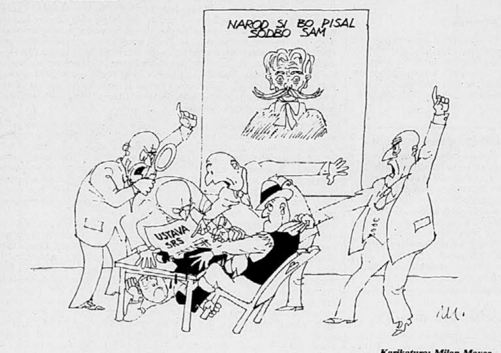
Karikatura: Milan Maver