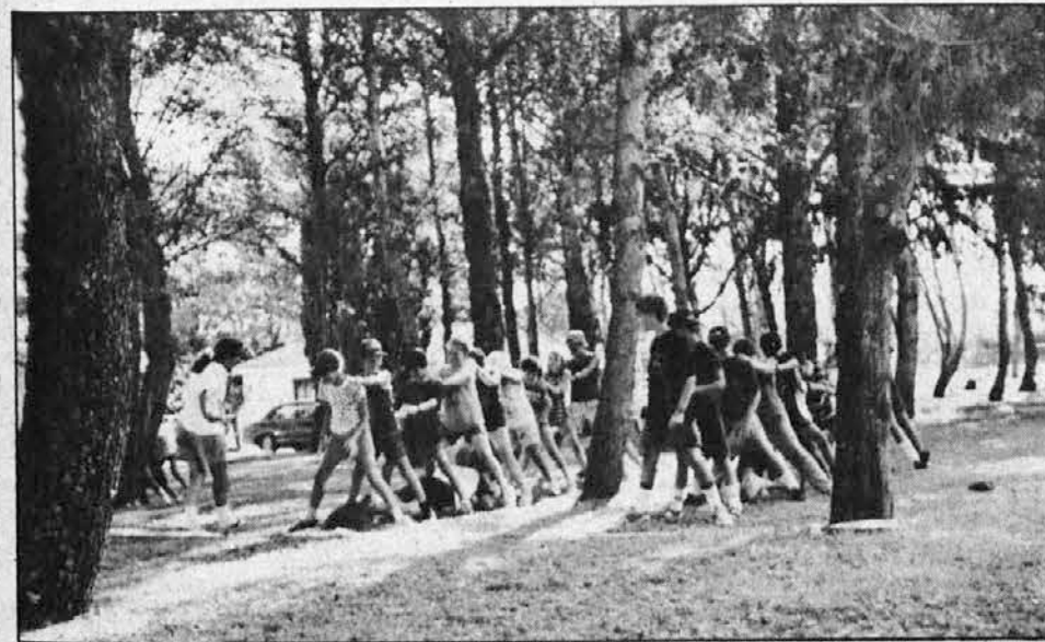
Športni dan v Domu dr. Rudolfa Hanželiča