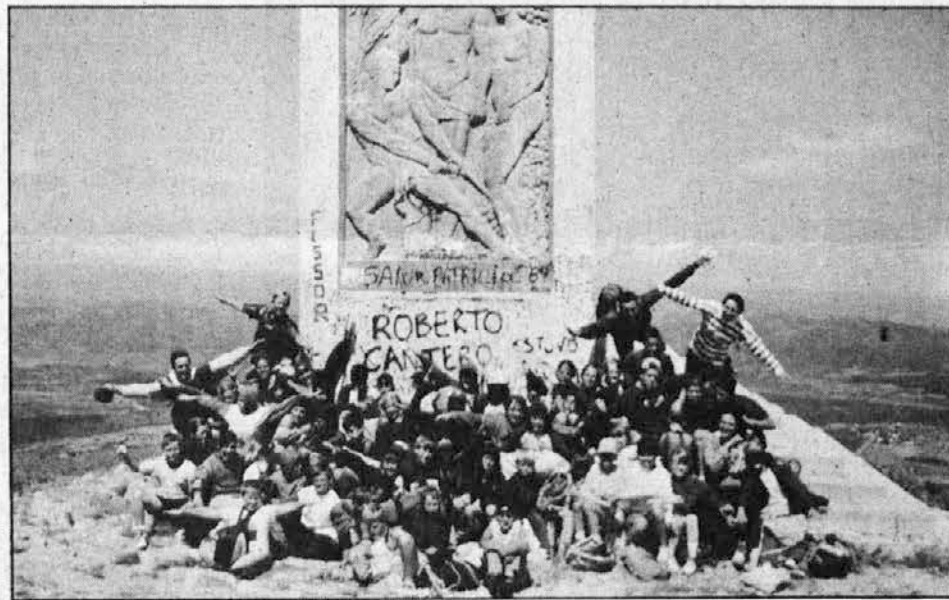
Otroci pri Mástilu