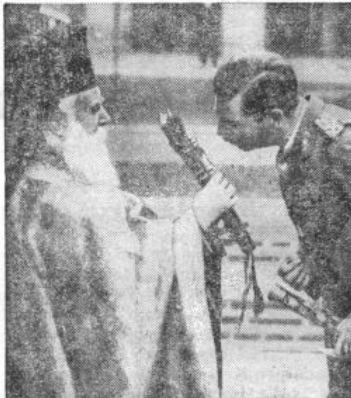
Mihajlov dan praznujejo v Romuniji s posebno slovesnostjo. Slika nam kaže kralja Karola, ko poljublja pri svečanostih sv. pismo.

Naše gospodarstvo je zdaj pred vprašanjem, kakšne posledice bodo imele zanj sankcije proti Italiji. Izvoz lesa ni prepovedan, in tako glede najvažnejšega našega izvoznega blaga ostane še dalje možnost izvoza. Izmed predmetov, ki nas zadevajo, je edino izvoz konj prepovedan, toda