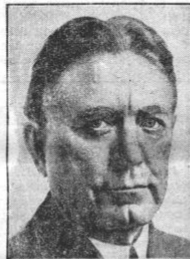
Ta mož je 70 let stari ameriški senator Borah, ki bo pri prihodnjih volitvah najresnejši protikandidat dosedanjemu predsedniku Rooseveltu.

Zadrugištvo se mora zdramiti in mu je treba pomagati. Tega se zaveda tudi država in kmetijski minister študira in dela načrte za iz-