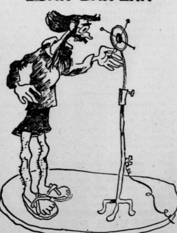
»Kdor hoče shujšati, naj povzije dnevno dve repi za zajtrk, tri datlje za večerjo, a nikoli ne mesa. Edino tako si privzgojimo nežnost in lepoto...«