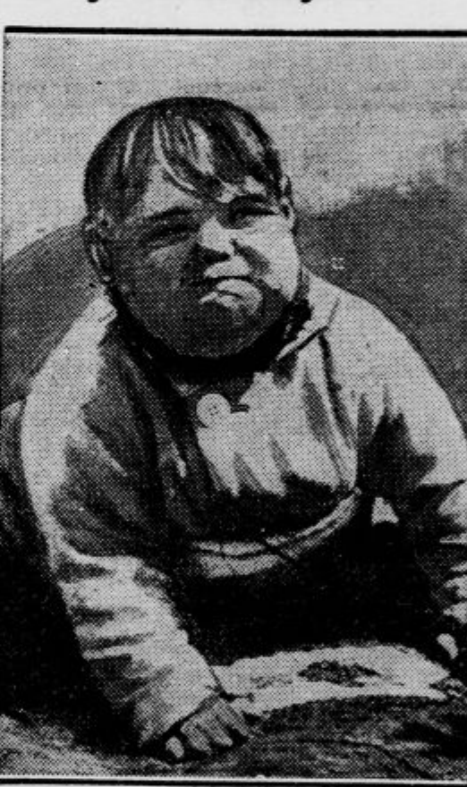
Je bil kancelar Hitler takšen, kakor kaže ta slika