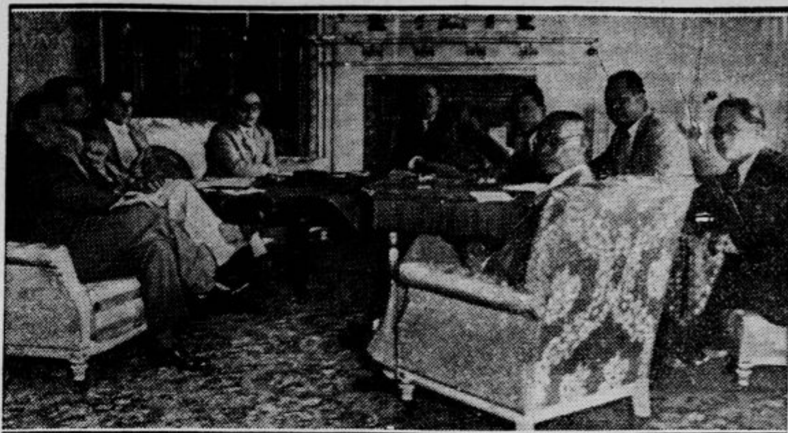
Zadnje dni so svetovni listi poročali o napetem položaju med Rusijo in Japonsko zaradi vzhodno-kitaške železnice. Medtem pa so se v Tokiu že zbrali predstavniki obeh prizadetih držav, ki skušajo konflikt omiliti s kompromisno rešitvijo