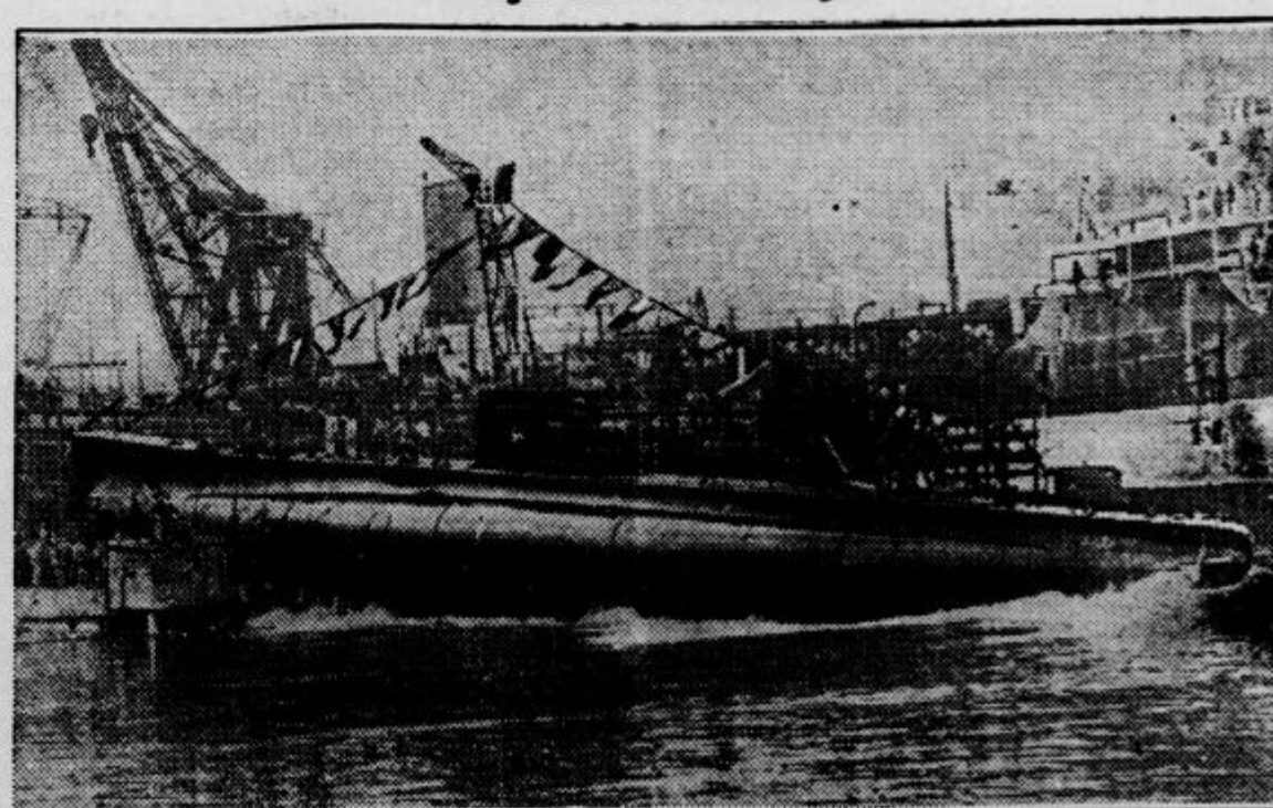
V Tržiču (Monfalcone) so nedavno spustili v morje novo italijansko podmornico »Galatea«, ki ima 640 ton