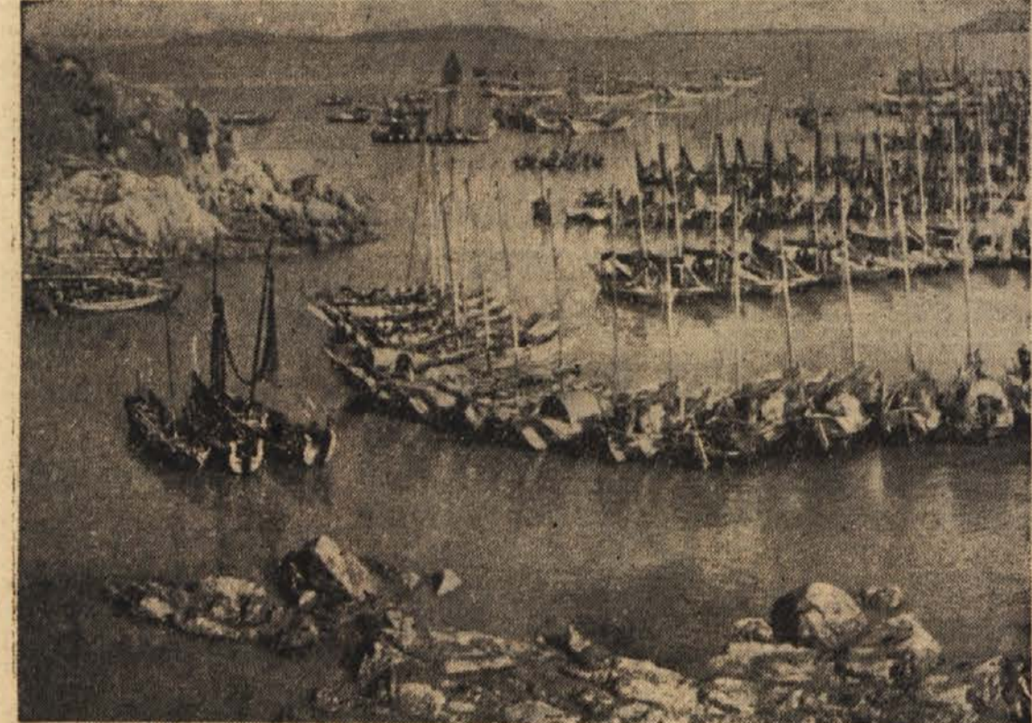
Takole je v enem izmed številnih ribiških pristančič na kitajski Rumeni reki, potem ko se ribiči in brodarji vrnejo z dela in razporedijo svoje džunke v rečnem zalivu

Strokovnjaki so s poskusi dokazali, da je nizek krvni pritisk piščancem mnogo nevarnejši kakor visok krvni pritisk, torej prav nasprotno kakor pri ljudeh. Med pticami z nizkim krvnim pritiskom je bila smrtnost skorajda dvakrat večja kakor pri tistih z visokim ali srednjim. Na univerzi v New Yorku so več let proučevali več sto kokoši. Vse do starosti 19 mesecev je bila smrtnost med njimi dokaj velika, medtem ko je bila nesnost zelo majhna. Vzroka oziroma povzročitelja tega pojava še niso mogli zanesljivo ugotoviti.