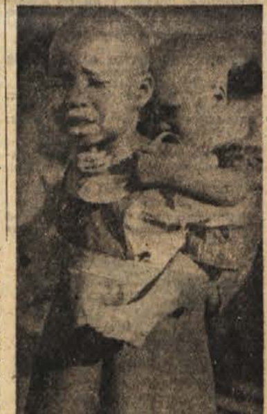
Potem ko stá dobila sladkorke, sta se kenijská malčka že toliko privadila, da ju je neki evropski turist v vasi Kaharah lahko ujel na filmski trak, kot kaže naš posnetek

Kmetje, ki so kopali krompir v dolinah blizu Fishofta v Angliji, so se v velikem preplahu razbežali, ko je neki bombnik angleškega vojnega letalstva vrigel bombo na bližnje njive. Sele pozneje so pojasnili ta dogodek. Letalo je bilo na vajah in je sprostito bombo po navodilih radarske komande, ki mu je napačno posredovala položaj (napaka je znašala sle 13 milj od cilja). Zanimivo je, da so angleška vojná letala v dveh tednih dvakrat odvrгла bombe na napačnem kraju.