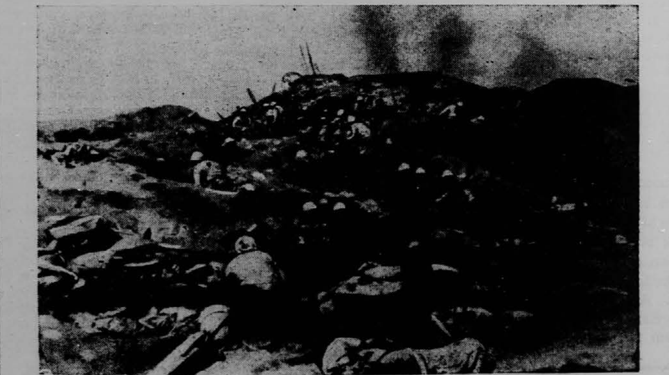
Prizor bitke na Iwo-Jimi (Žveplen otok), kateri otok je sedaj v polnem obsegu v rokah našega mornaričnega vojaštva.

Resnica je, da so zadnje čase povsod dodali nove zvezde. V nekdanji Evropi so bile po tri zvezde vse, kar se je moglo dobiti. Današnji višji častniki jih pa imajo že po pet.