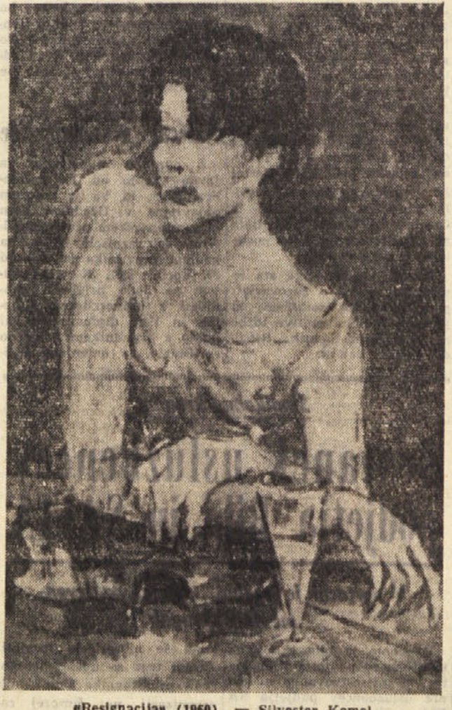
«Resignacijav (1960) — Silvester Komel