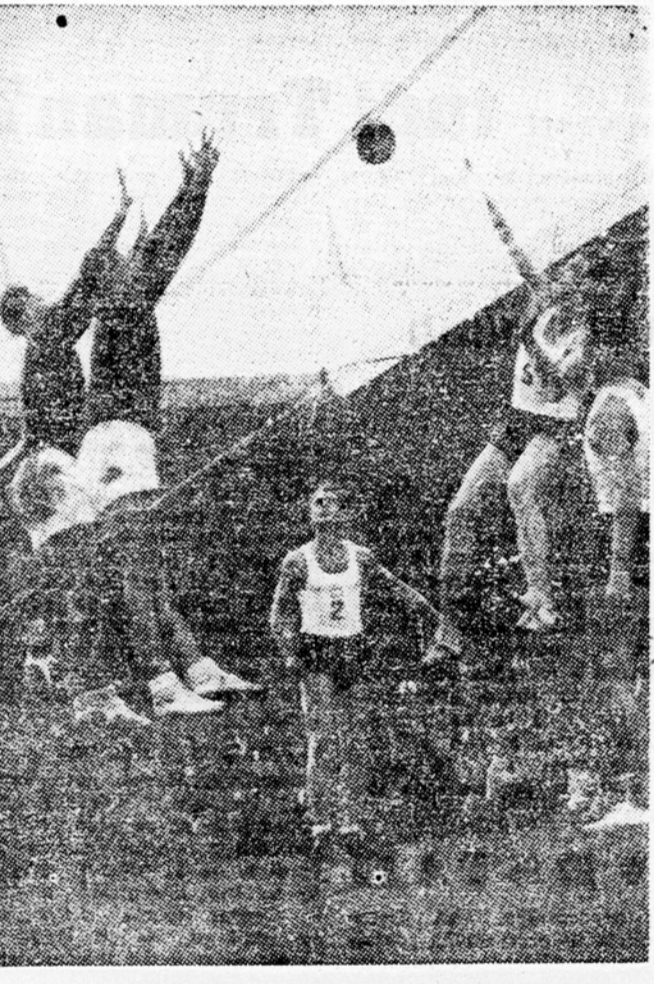
Po dohjeni igri kamniških odbojkarjev z Gregorčičem, ki je v nedeljo prišel v Kamnik (igra se je končala torej 3:0 p. f. v korist Kamnika ter po presenetljivi zmagi SD Prešerna Radoljica nad doslej vedočo Ilirijo) so Kamničani osvojili prvo mesto v zahodni skupini z 12 točkami pred Ilirijo.