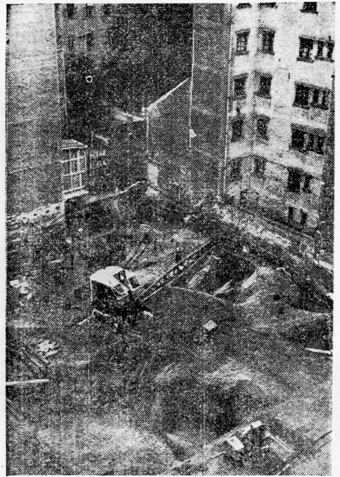
Med drugim vzbujajo zanimanje Ljubljancev gradbišče agencije za izvoz in uvoz (Slovenija-impex) na vogalu Kidričeve in Beethovne ulice. Devetnadstropna, izrazito poslovna stavba — ozka parcela ne dopušča gradnje stanovanj — bo po sedanjih računih sodbe pripravljena za vselitev konec prihodnjega leta. Zloris stavbe ima obliko približnega kvadrata v izmeri 25 m. Posebnost bodo hišne in ograjne naprave na katerih bodo lahko učili še drugi, če znanj, pa tudi neznanj graditeljev sodobnih stavb v bližnji prihodnosti.

S kakšno hitrostjo se bo ta prehod uresničil, je odvisno od osnovne razdelitve narodnega dohodka in nadaljnjega razvoja našega gospodarstva.