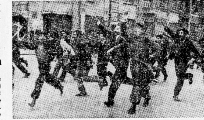
Velikimi množicami demonstratorji brali svoje resolucije proti tujim izkoriščevalcem in za mir natančno tako, kakor vsa taka vprašanja obravnava kominformovska propaganda. Na sliki primer take demonstracije z agitatorji Tudeha na čelu.

Pariz, 30. junija (Tanjug). V rubriki »Informacije«, ki jih »Humanite« ne daje svojim bralcom, javlja današnji »Figaro«, da je sekretar KP Francije, Jacques Duclos, na sestanku politične komisije centralnega komiteta napadel nekatere voditelje federalnih in lokalnih organizacij KP Francije, zlasti v Nici in Marseilleu, zaradi velikih napak pri izvajanju politične etnotne akcije s socialisti, ki jo v zadnjem času propagira KP Francije. Po mnenju Duclosa so bile storjene te napake zaradi slabe ideološke izobrazbe večine voditeljev KPF. V tej zvezi je opozoril tudi na zelo slabo ideološko izgradnjo delavskih množic. Dejal je tudi, da so vodstva rajonjskih in federalnih organizacij birokratične.