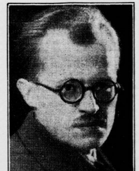
njegovega slikanja. Riše jih hladno, brez lažnih predsodkov. Enostavno je življenje teh ljudi, a prav v tej enostavnosti najlepše.

upajo. In kar je pri tem največ vredno: ni hinavec, da bi risal te stvari zaradi senzacijski, zaradi zanimivosti. Riše jih zato, ker so takšne, ker jih mora zajeti v okvir