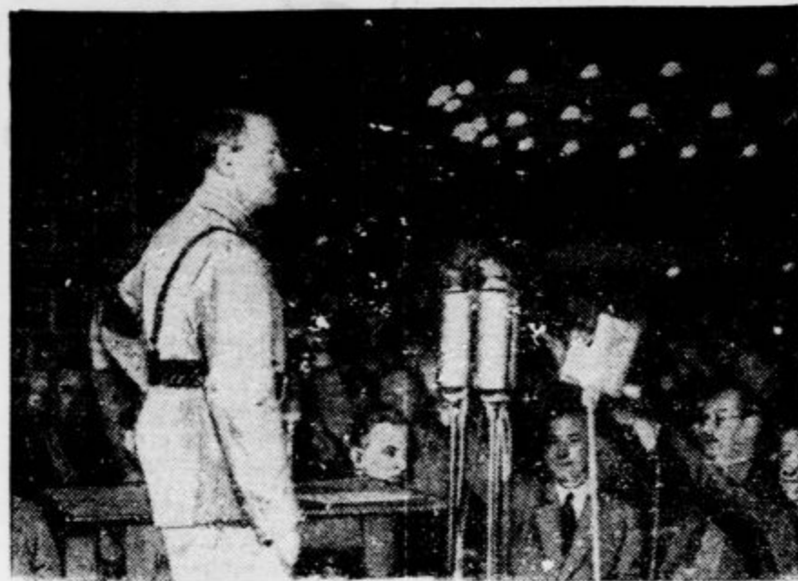
Nemški kancelar Hitler je te dni govoril na jubilejnih svečanostih 15. obletnice ustanovitve narodno-socialistične stranke v Monakovem