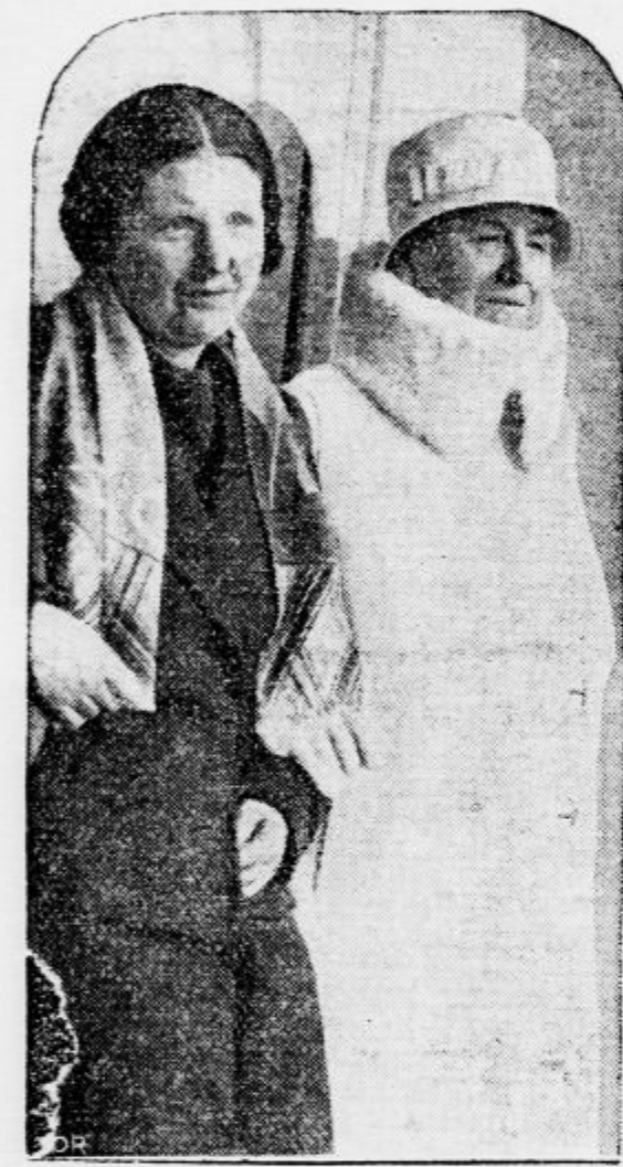
Holandska kraljica Viljemina s prestolonaslednico princoso Julijano, ki se bo po najnovejših vesteh omožila s sinom švedskega princa Bertila