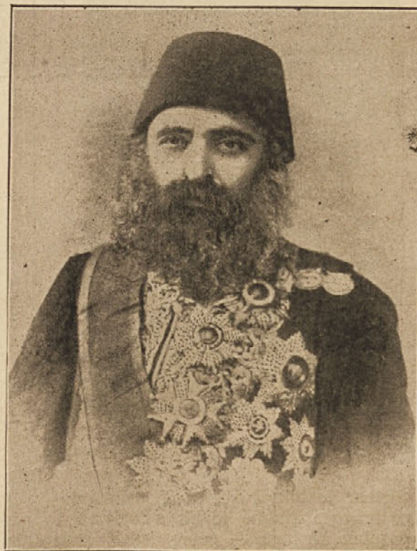
Turški novi ministrski predsednik Said Paşa.

Italija je gotovo računala, da cela njena akcija v Tripolis ne bode trajala zelo dolgo in vsled tega ne bo veliko stala. Zato je tudi navdušenje za tako podjetje v Italiji splošno. Tisoče ljudi kriči po raznih mestih vladi in vojakom „eviva“, posebno glasni so tisti, ki jim ni treba pod puško! Počasi pa se izkazuje, da bo