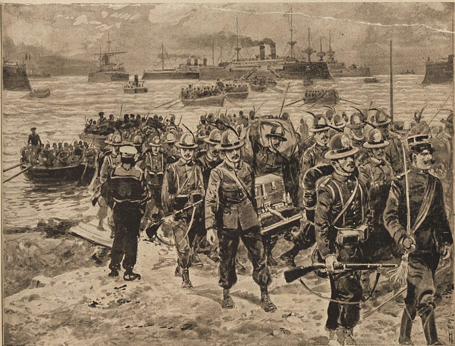
Italijansko-turška vojna: Izkreavanje italijanske vojske pri Tripolisu pod zaščito mornarice, ki je obstreljevala utrdbe, iz katerih so se morale umakniti turške posadke.