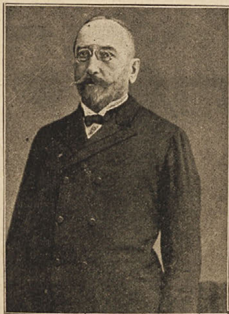
Cvetlični dan v Ljubljani: Iv. Hribar, protektor.