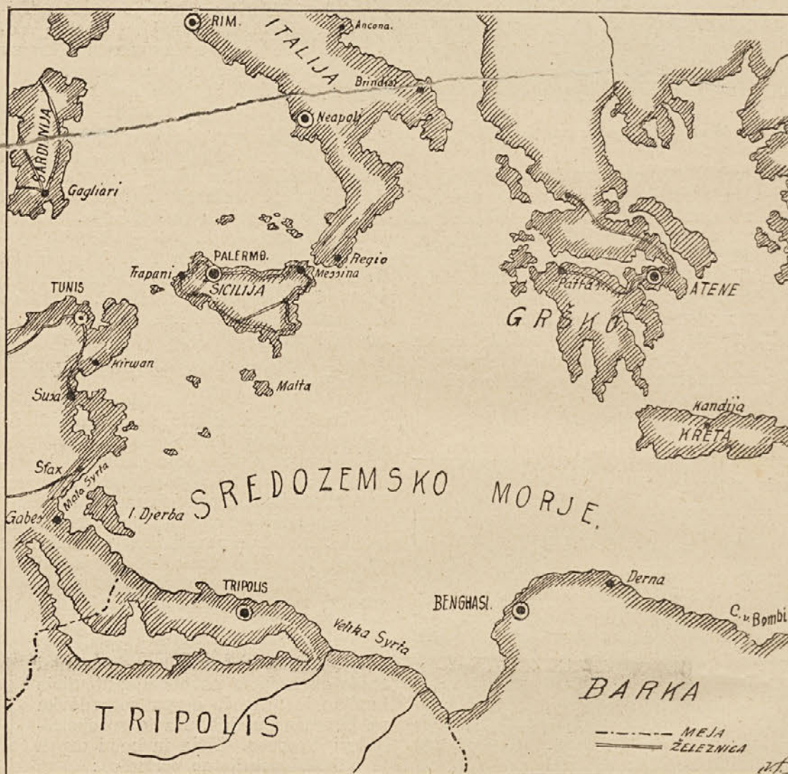
Italijansko-turška vojna: Zemljevid bojišča.

obraz živih, izrazitih oči ter njena vitka postava jo tudi zunanje usposobljata za subreto. V operi „Janko in Metka“ je prav lepo pela in igrala Janka. Tako je letos