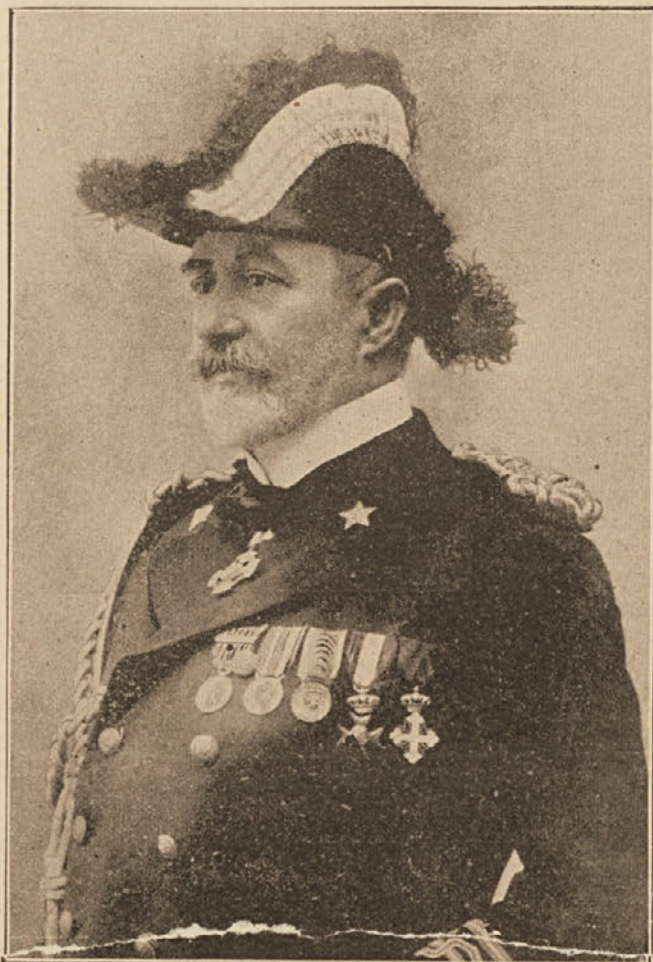
Admiral italijanske mornarice Avgust Aupiais.

stare velike in nekaj malih novih ladij in sicer je moč Italije na morju sledeča: Novih težkih bojnih ladij ima Italija 14 in sicer: 1 z 9833 tonami (1 tona je 1000 kg, ker ladje se merijo po tem, koliko nosijo), 2 ladji z 10.118 tonami, 4 z 12.625 ton., 2 s 13.430 ton., 1 z 9800 ton., 3 z 7350 tonami; povrhu še 2 oklopni križarki s 6500 tonami, 7 starejših težkih bojnih ladij, 11 križark, 9 starejših torpedovk, 23 torpedorušilcev, 124 novejših torpedovk in 15 podmorskih čolnov. To je vse skupaj že zelo močno brodogradnja.