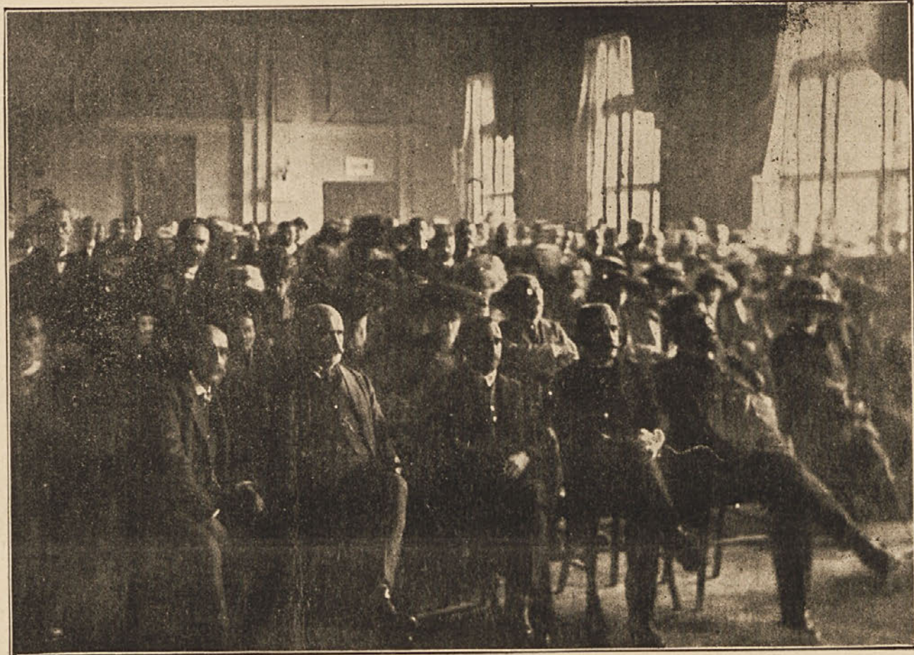
Izredno zborovanje slovenskega učiteljstva v Ljubljani. (Ker je bilo zborovanje proti večeru, fotografija in torej tudi slika ni dovolj jasna; vidi se pa vendar, da je bil shod jako dobro obiskan.)