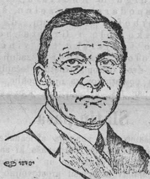
Geh. Rat. Friedr. Graf v. Toggenburg, Statthalter in Tirol

Od italijanske vojne je Tirolska prav hudo