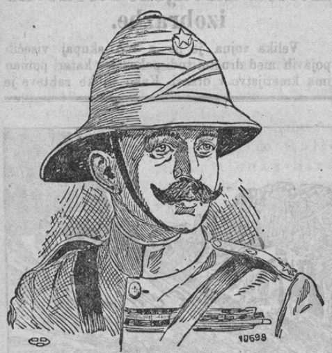
Freiherr v. Slatin-Pascha

Prinašamo sliko znanega afričanskega potnika in učenjaka plem. Slatin-paša, ki se je zdaj v navdušenju za domovino in ogorčenju nad laškimi izdajalstvom oglasil prostovoljno k vojaški službi zoper Italijo. Slatin-paša bil je l. 1857 pri Dunaju rojen; prišel je kot trgovec v Egipt, spremlil l. 1875 Henglina v Chartum in napravil samostojno znanstveno potovanje v takrat še neznan Džebel Nabur. Potem je ugodil na Avstrijskem svoji vojaški dolžnosti, se udeležil vojne v Bosni, šel potem zopet v Egipt in postal