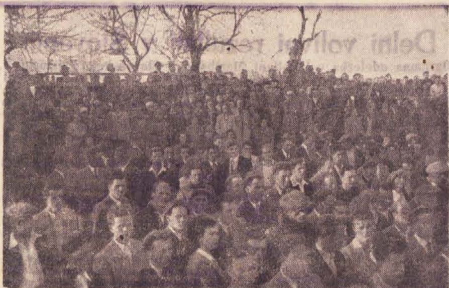
PREDVOLIVNO ZBOROVANJE V NOVI VASI

Hkrati z volivno agitacijo pa se razvija medsebojno kolektivno tekmovanje. Tako so člani kolektiva »Iceta« (gradbeno podjetje) objavili, da bodo do 29. novembra dogradili reprezentativen hotel v Kopru, do 1. maja pa zaključili z grad-