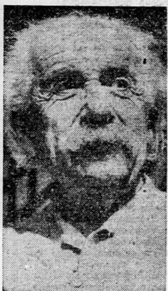
Pokojni dr. Albert Einstein

človeštvo odpove vojni, ugotavljajo, da se ni lahko lotiti te alternative, kajti zelo težavno je odpraviti vojno. Odprava vojne bo zahtevala nezaželene omejitve državnih suverenosti.