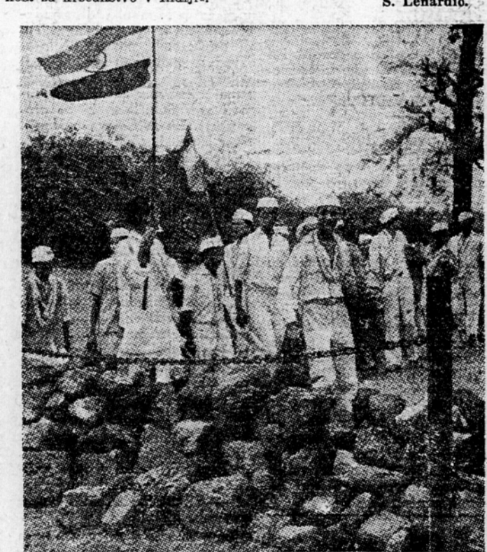
Skupina indijskih prostovoljcev, ki je lani vkrakala v Goe, kakor poročajo, bo 1. avgusta nekaj sto neoboroženih prostovoljcev ponovno vkrakalo v Goe, da bi tako demonstriralo enotnost te portugalske kolonije z Indijo

piše zato ocenjujejo Nehrujev obisk Vatikanu kot »sudarec Portugalski, ki je skušala pridobiti svetovno javnost proti Indiji v znamenju gesla »nevarnost za krščanstvo v Indiji«.