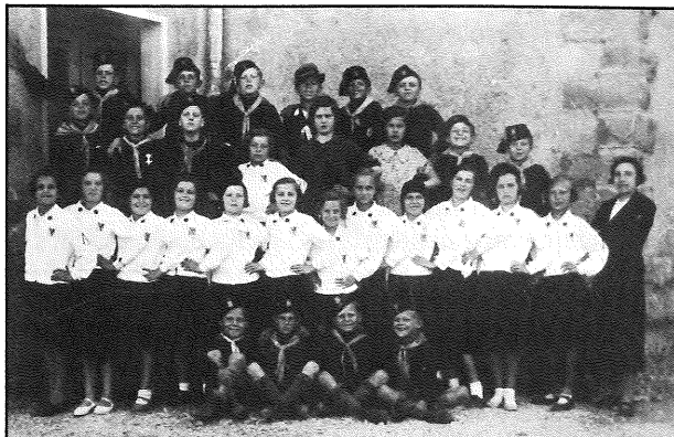
4. Učenci šole v Boljuncu v dobi fašizma.

Glede konecletnega stanja na šoli ob obisku, redovanju, napredovanju in uspehih nima podpisani nikakih