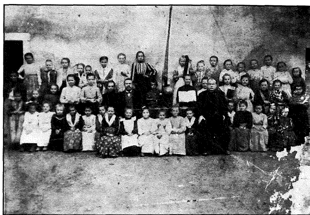
2. Učenci šole v Boljuncu 15.12.1905.