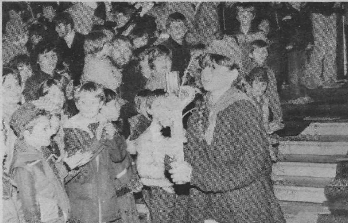
Letošnja štafeta mladosti je prispela v Ljubljano 26. aprila. Približno ob 19. uri so jo iz rok bežigraskih vrstnikov na križišču Titove ceste in Ceste VII. korpusa prevzeli mladinci iz naše občine. Po vsej poti po Centru so jo mladi toplo pozdravljali, del poti, od Sentjakobskega mostu do Tromostovja, pa je potovala po Ljubljanici, zato je bilo živahno in veselo tudi na obeh bregovih reke. Najprisrčnejše vzdušje je bilo pred Magistratom, kjer so na osrednji prireditvi v naši občini prebrali tudi pozdravno pismo, nato pa je štafeta nadaljevala pot proti Domu španskih borcev, kjer je tudi prenočila.