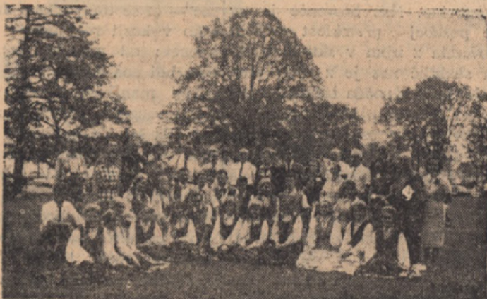
Na obisku pri litvanski plesni grupi, ki je natsopila v Niagari.