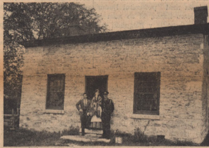
Pred staro hišo v "Upper Canada Village".

● Stevilo smrth žrtev zaradi letalskih nesreč v ZDA je bilo 310 1. 1959; 378 1. 1960; 135 1. 1961; 183 1. 1962 in 146 1. 1963. Letošnje število žrtev je znatno večje — 286 do srede maja. Vključena je nasreča vojaškega letala (77 mrtvih) ter dve nesreči (95) mrtvih potniških letal izven rednega prometa. ● Harvard univerza je dobila 5 milijonov dolarjev za študij posledic, ki jo ima uvajanje avtomatiziranih organiziranih preprečitev vprizoritve komedije "Topla greda" v izvedbi "Odra 57". Policija je to storila tako, da je nagala v gledališče v Križankah "delovni kolektiv" nekega socialističnega posestva iz okolice Ljubljane, na poslovanje in izgube katerega leti satira komedije. Ta nastop je sprožil burne proteste gledalcev in drugih, zaradi česar si pisca verjetno še niso upali zapreti.