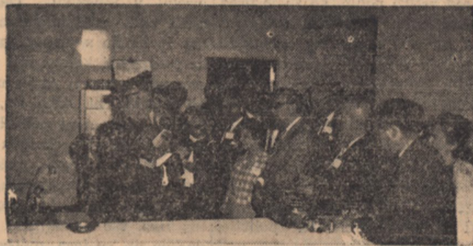
Policijske barake v Brockvillu.