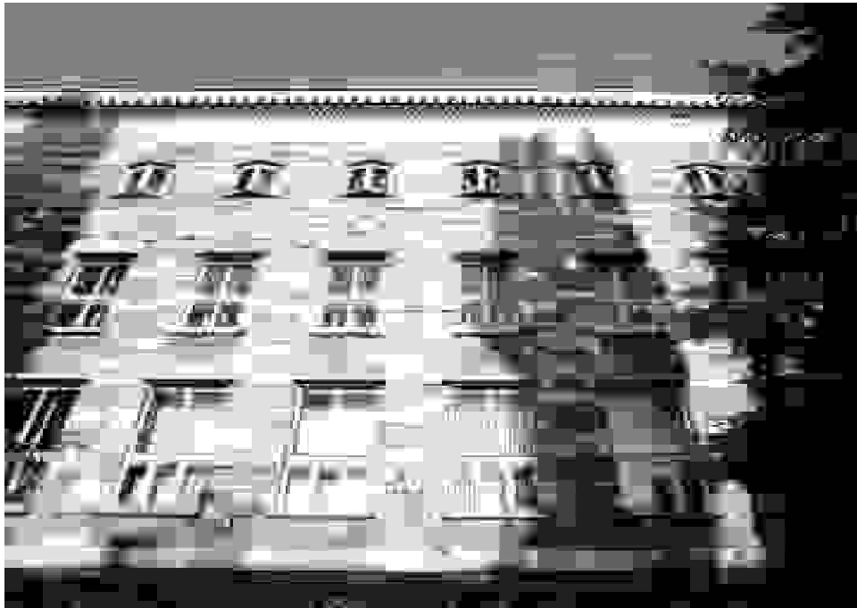
Narodna in univerzitetna knjižnica, eno najpomembnejših Plečnikovih del

Velik pečat v arhitekturi celotnega mesta je Plečniku uspelo zapustiti zaradi slogovne izjemnosti njegovih del, ki odstopajo od ustvarjalnih del vseh znamenitih Plečnikovih sodobnikov. Plečnikov arhitekturni jezik ni zavračal preteklosti. Črpal je iz klasične in jo samosvoje predeloval, obenem pa je vnašal tudi prvine narodnega podoba. Tudi zato so nekateri sodobni arhitekti v osemdesetih, ko je prišlo do „ponovnega odkritja“ Plečnika, največjega slovenskega arhitekta primerjali celo s postmodernizmom.