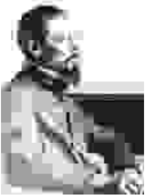
Arhitekt Jože Plečnik