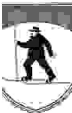
Sedanji grb občine Bloke

Zakaj se je smučanje razvilo ravno na Blokah? Starim Bločanom so bile smuči nujno potrebne. Bloška planota je oblo, razgibano hribovje v višini med 740 in 1038 m. Gol, odprt svet prekinja redek gozd. V hudih zimah se debela snežna odeja obdrži tudi 4 do 5 mesecev. Pogosti vetrovi nabijejo sneg v do 5 m visoke zamete. V takih okoliščinah je potovanje oteženo. Smučanje na Blokah se je razvilo iz potrebe, smuči so uporabljali pri lovu, sečnji in drugih opravilih, ki zahtevajo gibanje.