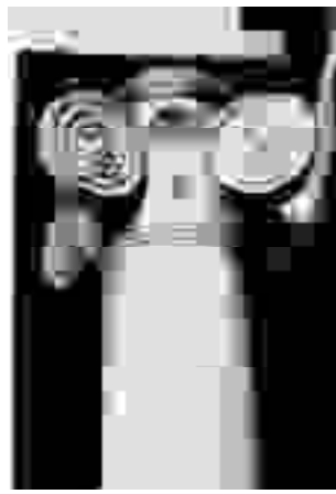
Prijubljen Plečnikov detalj na čelu tržnice ob reki Ljubljani

Plečnik se ni posvečal le načrtovanju osupljivih stavb; blizu mu je bilo tudi bolj subtilno oblikovanje. Še danes slovi Plečnikovo pohištvo, čudovita pa je tudi njegova zbirka kelihov in druge opreme za izvajanje cerkvenega obredja. Plečnik je oblikoval tudi svoj nagrobnik. Ta stoji na ljubljanskem pokopališču Žale, na družinskem grobu Plečnikovih, kamor so arhitekta pokopali po smrti 7. januarja 1957.